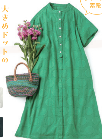
〈ワンピース/グリーン〉 ¥8,580