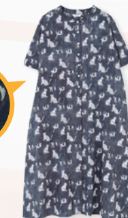
ネコ柄ブロックプリント 〈ワンピース〉¥9,680