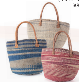
〈サイザルバッグ〉 S・M・L ¥4,180~¥7,480