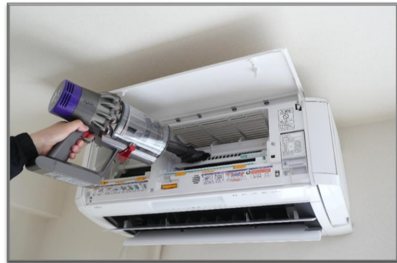
④冷却フィンのホコリは掃除機などで吸い取ります。