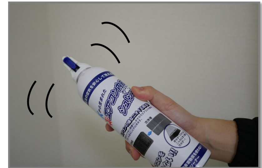
⑥エアコン内部クリーナーシュ！シュ！をよく振ります。