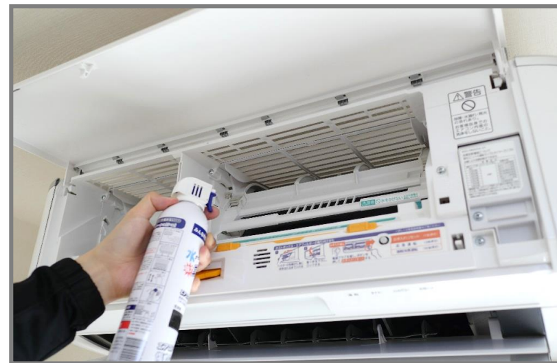
⑦エアコン内部クリーナーシュ！シュ！をよく振ってから5cmほど離してフィンの向きに沿ってスプレーします。