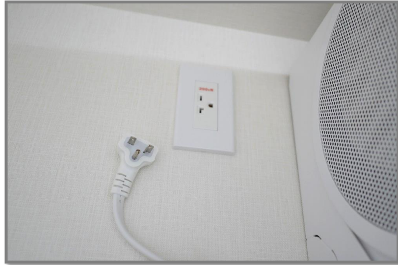
①電源を切ってから、コンセントを抜きます。