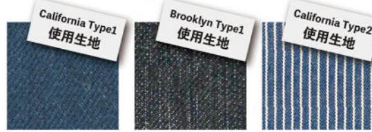
D ブルー D ブラック D ヒッコリー