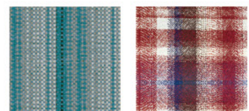
ストライプ チェック