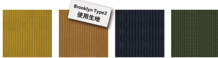
C キャメル C ブラウン C ネイビー C カーキ