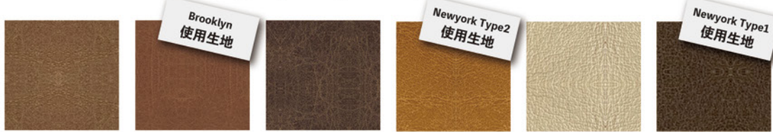
VL 8919 VL 8920 VL 8922 BA 01 BA 02 BA 06

BA01, 02, 06 は、次亜塩素酸の吹き付け消毒に対応するパロンシリーズです。