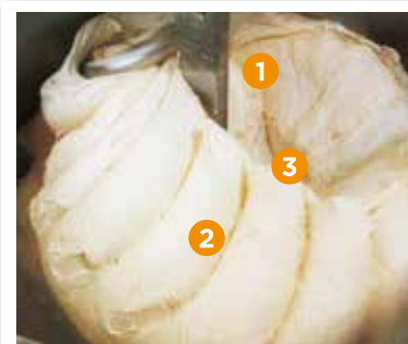
3 Zone Mixing

センターシャフトと生地の上に空間ができ、空気を抱き込みやすい状況が作られます。空気が生地に多く入り込まれるため、ボリューム良く焼きあがります。