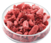
フレーズ フレーク [500g×4]