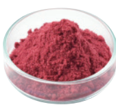
フランボワーズ パウダー [100g×5]