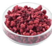
フランボワーズ プリゼ [500g×4]