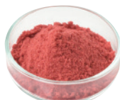
フレーズ パウダー [500g×4]