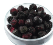
ミルティユ ホール (ブルーベリー) [500g×4]