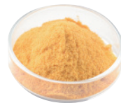
マンゴ パウダー [100g×5]