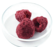
フランボワーズ ホール [500g×4]