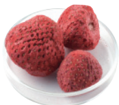
フレーズ ホール [500g×4]