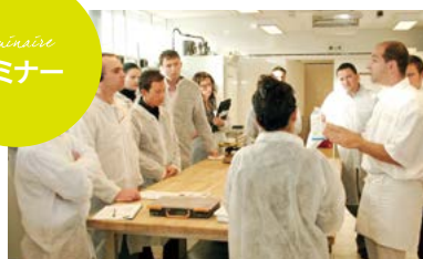
講習会や勉強会を通してご提案