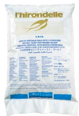
サフ セミドライイースト ホワイト(赤タイプ)/冷凍