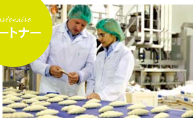
お客様の要望にお応えし、あらゆる技術・製法の提案と情報の提供