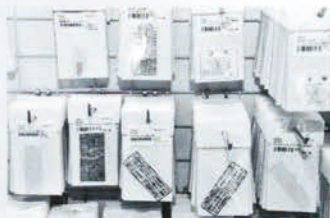
●コーションステッカーも豊富。これはヨンフォア用。空気圧、速度警告灯、バッテリー取り扱いまですべてカバー。

〒770-0861 徳島県徳島市住吉5-8-31 ☎088-622-0003 FAX088-622-0340 営業時間:10:00~19:00 ※休日:日曜日、第2第3土曜日