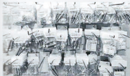
●ここに写っているステンレス製ボルトはほとんどがZ400FX用。ヘッドカバー用からブレーキキャリパー用までFXのボルトがひとつとおり揃う。