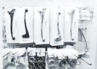
●レバーの下はエキゾーストのガスケット。スプリング類も豊富だ。