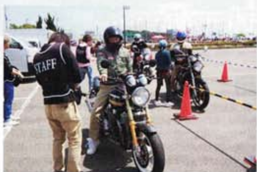
会場入り口にはスタッフが配置され来場者を誘導、混乱なくスムーズに皆さん駐車して頂きました。さすが!

撮影●西田まさし/鈴木広一郎 協力●BRC ( http://www.brcinc.co.jp )