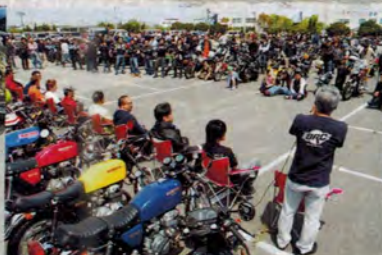
出店してくれた各ショップさんの代表者が来場者の前で自己紹介を行った。