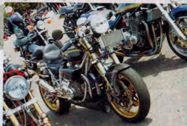
来場車両には力作のカスタム車両も多く見受けられた。ウーン、スゴイ!