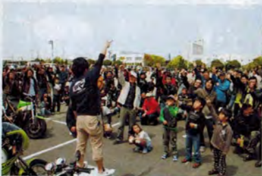
お待ちかね、子供たちも参加して13時からじゃけん大会! 熱くなるね。