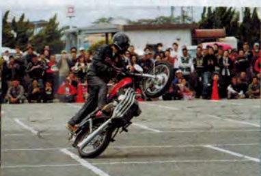
ザ・バイクスタント・ファイネストによるエクストリームショーでは、ヨンフォアでも!