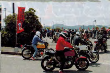
開場時刻の10時となると続々とバイクが会場入り。もちろん、絶版車が多くを占めた。記念ステッカー付で入場料は1台1000円。