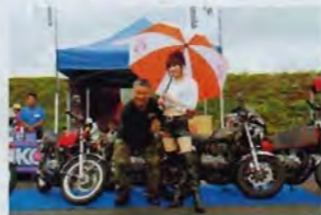
カスタムバラノイア、枚方市のショップでオリジナルパーツも各種取り揃えています。