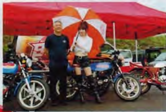
アゲイン、今回はスリッパークラッチ装置の試乗車を持ってきていたり、オリジナルパーツの特売、たこ焼き屋の店主と大にじし。