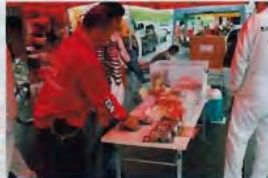
ミーティング開始早々は夜に降った雨の影響が少し残って参加者の出足が少し鈍っていたけど出店ショップのテントには人が沢山集まっていた。ミーティング特別価格とかも設定されていたこともあり好評だった様子、ショップ自慢のカスタム加工されたパーツも展示されており目を楽しませていた。