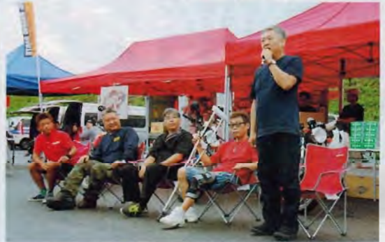
出店してくれたショップ代表による挨拶と得意分野のアピールタイム、ショップの方向性とかが判ってこれからカスタムするオーナーの参考になったようだ。