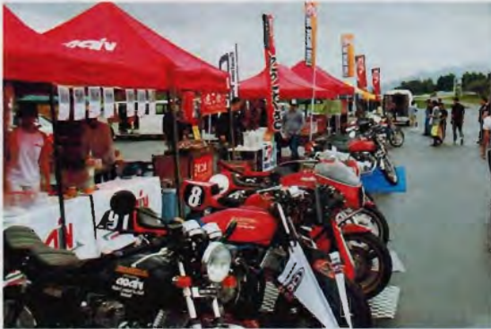
主催者、徳島のBRC。多くのカスタム車両とオリジナルパーツの展示即売で賑わっていた。会場のセッティングから色々お疲れ様です。