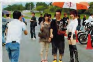
キャンギャルが移動するとあちこちで撮影会が始まる、ツーショットから仲間たちと一緒に撮影パターンは様々。気軽に応じてくれたのが気持ちいい。