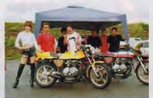
関東からの出店、おなじみオートスキャン。遠くから参加有難う御座います。