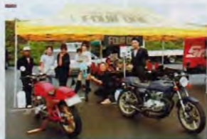
FOURONE、サイドリンクCRキャブの展示に皆興味深々の様子だった。