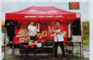
徳島のSNAP・ON西谷、日常見ることのない高級工具に見とれる人多数。