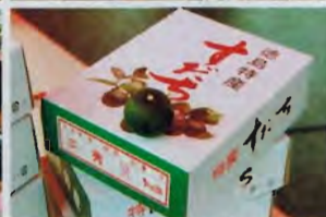
ミーティング開催中はあちこちで各自色々楽しんでいようだ、エクストリームのライダーにサインをしてもらったりショップのデモ車両を観察したり、BRCのブースではさすが徳島って思わせる特級品の「すだち」も販売されていた。