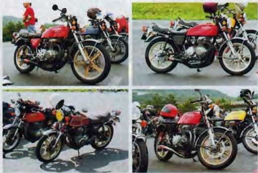
来場したCB400Fは指定の場所に、綺麗に当時の姿を維持し続けたオーナーやライトカスタムからフルカスタムまで様々な車両が集まった。