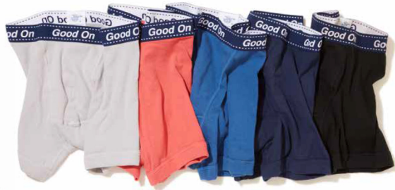
item name. BOXER BRIEF style. GOUW1701 color. BLACK, NAVY, GRAY, CHERRY, MARINA size. S, M, L price. ¥3,900 +tax