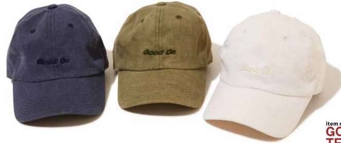
item name. GOOD ON EMB TEE LOW CAP style. GOGD1809 color. P-BLACK, P-NAVY, P-TURQUOISE, P-NATURAL, P-SAGE size. ONE price. ¥4,500 +tax