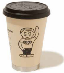
item name. MOBILE TUMBLER MINI style. GOGD1807 size. 97x138mm(300ml) price. ¥4,600 +tax