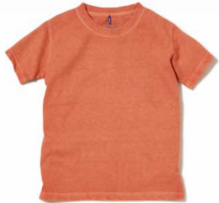
item name. KIDS S/S CREW TEE style. GOST-701KD color. WHITE, P-NAVY, P-SAX, P-MOCHA, P-PINK, P-F.RED, P-SAGE, P-PERSIMMON size. 100, 110, 120, 130, 140 price. ¥2,900 +tax