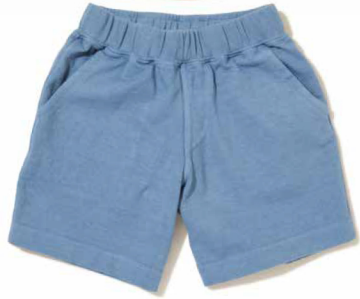
item name. KIDS TRAVEL SHORTS style. GOPT1602K color. NAVY, SMOKY BLUE, P-NAVY, P-F.RED, P-NATURAL, P-SAGE size. 100, 120, 140 price. ¥6,500 +tax