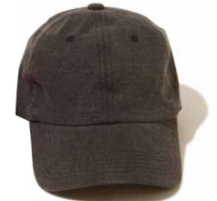
item name. TEE LOW CAP style. GOGD1808 color. P-BLACK, P-NAVY, P-TURQUOISE, P-NATURAL, P-SAGE size. ONE price. ¥3,800 +tax