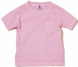
item name. KIDS S/S POCKET TEE style. GOST0903KD color. WHITE, P-NAVY, P-SAX, P-MOCHA, P-PINK, P-F.RED, P-SAGE, P-PERSIMMON size. 100, 110, 120, 130, 140 price. ¥3,500 +tax