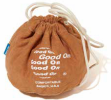
item name. TEE KINCHAKU style. GOGD1810 color. P-NAVY, P-SAX, P-VIOLET, P-SAGE, P-BANANA, P-MOCHA, P-DK.GREEN, P-CHOCO, P-SLATE size. ONE price. ¥2,900 +tax