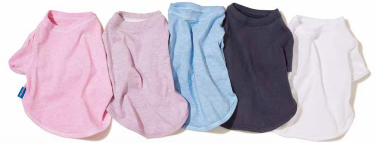
item name. DOG TEE style. GOGD1801 color. WHITE, P-BLACK, P-NAVY, P-F.RED, P-SAGE, P-SAX, P-LEMON, P-PINK, P-VIOLET, P-SMOKY GREEN size. S, M, L, XL price. ¥2,900 +tax