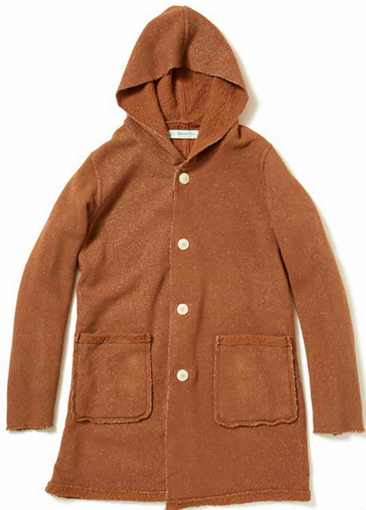
item name. NAPA COAT style. GOBW1705 color. IVORY, BLACK, NAVY, MOCHA, ARMY ssize. ONE price. ¥18,000 +tax