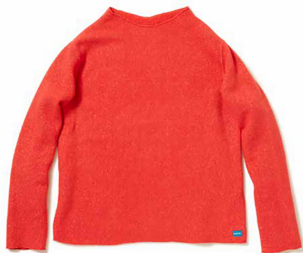
item name. CUT OFF FLEECE style. GOBW1705 color. IVORY, BLACK, NAVY, RED, DK.GREEN size. ONE price. ¥8,500 +tax