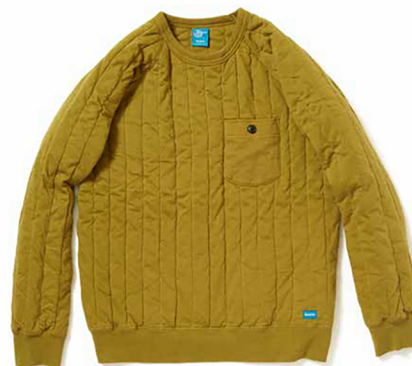
item name. L/S PADDED CREW SHIRTS style. GOBW1710 color. BLACK, NAVY, MOSS, G.GREEN ssize. S, M, L price. ¥14,000 +tax