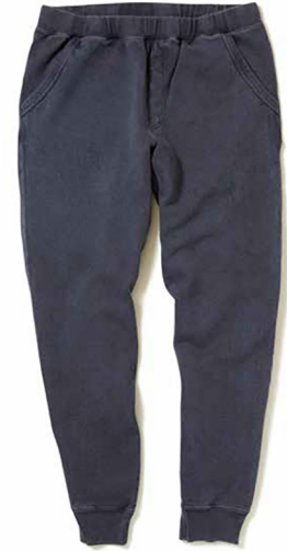
item name. NARROW SWEAT PANTS style. GOBW1418 color. METALGRAY, P-BLACK, P-NAVY, P-SAGE, P-SMOKY GREEN