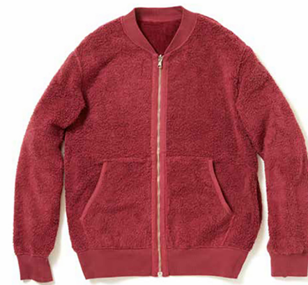
item name. BOMBER JKT style. GOBW1702 color. BLACK, NAVY, ARMY, BURGUNDY ssize. M, L price. ¥24,000 +tax