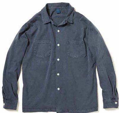
item name. L/S OPEN TEE SHIRTS style. GOLT1712 color. P-NATURAL, P-BLACK, P-NAVY, P-MUSTARD, P-SMOKY GREEN ssize. S, M, L price. ¥10,500 +tax