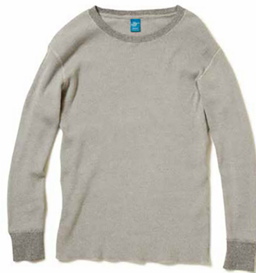
item name. L/S THERMAL TEE style. GOLT1202 color. WHITE, P-BLACK, P-NAVY, P-F.RED, P-SAGE, P-BORDEAUX, P-BANANA, METAL GRAY ssize. S, M, L price. ¥5,400 +tax