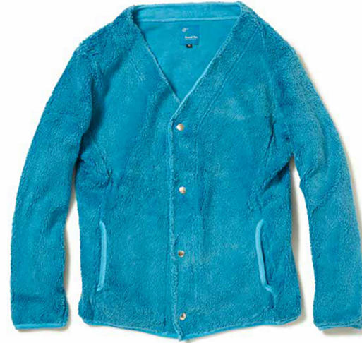
item name. BOA CARDIGAN style. GOBW1712 color. P-NAVY, P-BORDEAUX, P-SAGE, P-GRAY, P-MUSTARD, P-TURQUOISE