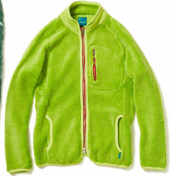
item name. BOA FREEDOM JKT style. GOBW1506 color. P-NAVY, P-SAGE, P-BORDEAUX, P-TURQUOISE, P-SUNNY GREEN ssize. S, M, L price. ¥18,800 +tax