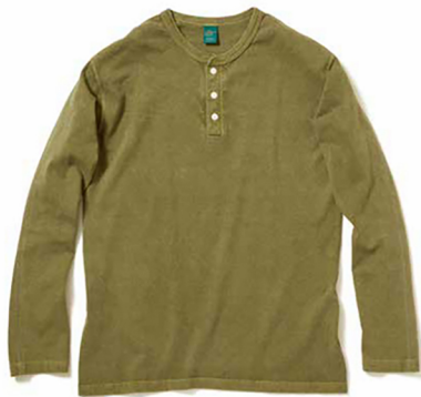
item name. L/S HENLEY TEE style. GOLT1601 color. WHITE, P-BLACK, P-NAVY, P-F.RED, P-SAGE, P-ASH ssize. S, M, L price. ¥5,900 +tax