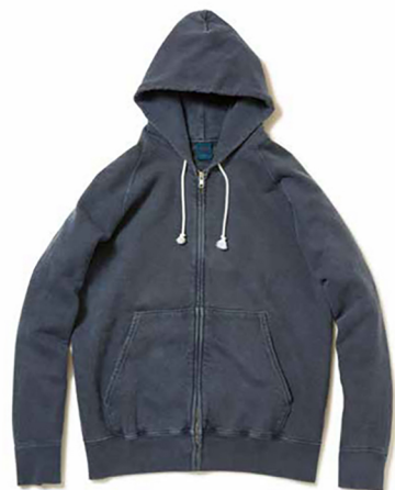
Item name. RAGLAN ZIP HOOD SWEAT style. GOBW-502 color. METALGRAY, P-BLACK, P-NAVY, P-F.RED, P-SAGE, P-GRAPE, P-TURQUOISE ssize. S, M, L price. ¥13,800 +tax