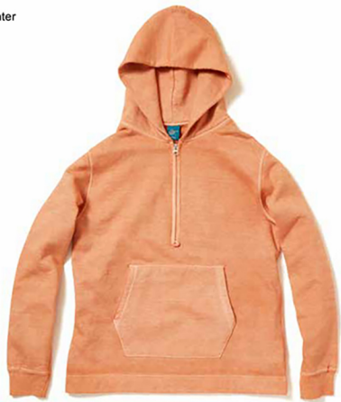
Item name. ROUGH 1/2 ZIP P/O HOOD SWEAT style. GOBW1610 color. METALGRAY, P-NAVY, P-F.RED, P-BORDEAUX, P-GRAPE, P-TURQUOISE, P-PERSIMMON, P-SUNNY GREEN ssize. S, M, L price. ¥12,800 +tax