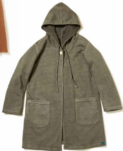
item name. HOOD COAT style. GOBW1608 color. METALGRAY, P-NAVY, P-SMOKY GREEN, P-MOCHA, P-GRAY ssize. ONE price. ¥14,800 +tax