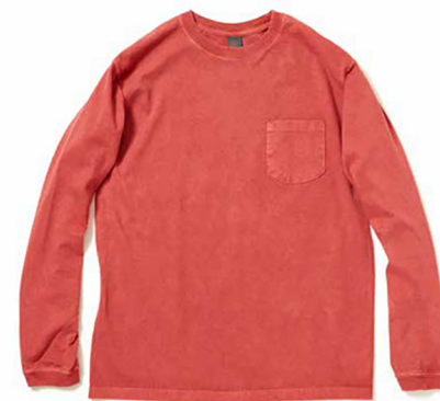
item name. L/S POCKET TEE style. GOLT1306 color. WHITE, METALGRAY, P-BLACK, P-NAVY, P-F.RED, P-SAGE, P-BANANA, P-GRAPPE, P-SUNNY GREEN ssize. S, M, L price. ¥5,200 +tax