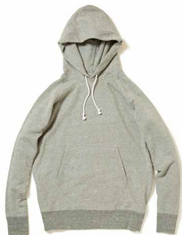
Item name. RAGLAN P/O HOOD SWEAT style. GOBW1203 color. METALGRAY, P-BLACK, P-NAVY, P-NATURAL, P-F.RED, P-GRAPE, P-BANANA ssize. S, M, L, XL price. ¥12,000 +tax