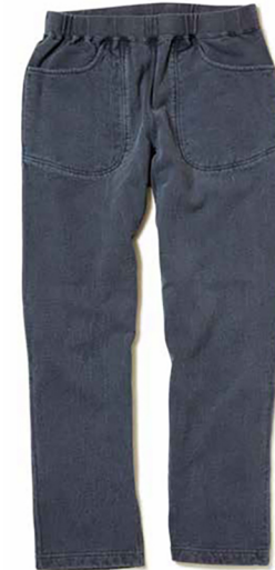
item name. SWEAT PANTS -SLIM FIT- style. GOPT1711 color. METALGRAY, P-BLACK, P-NAVY, P-SAGE, P-BORDEAUX, P-NATURAL, P-SMOKY GREEN