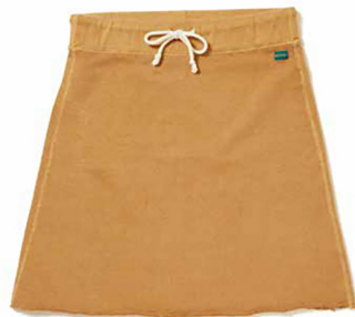
item name. SWEAT SKIRT style. GOSK1703 color. METALGRAY, P-NAVY, P-SAGE, P-SLATE, P-MOCHA, P-BORDEAUX, P-GRAPE ssize. ONE price. ¥6,600 +tax