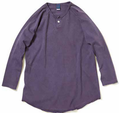
item name. ONE BUTTON BASEBALL TEE style. GOLT1505 color. WHITE, METALGRAY, P-BLACK, P-NAVY, P-DK.GREEN, P-BORDEAUX, P-GRAPPE, P-PERSIMMON ssize. M, L price. ¥5,500 +tax