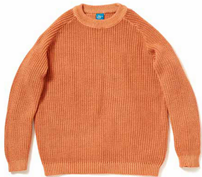
item name. CREW COTTON SWEATER style. GOBW1710 color. P-BLACK, P-NAVY, P-NATURAL, P-MUSTARD, P-PERSIMMON, P-SMOKY GREEN size. S, M, L price. ¥16,800 +tax