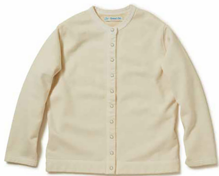
item name. CREW SWEAT CARDIGAN style. GOBW1711 color. P-NATURAL, P-GRAY, P-BORDEAUX, P-GRAPE, P-SMOKY GREEN size. ONE price. ¥9,500 +tax