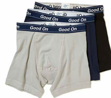
item name. BOXER BRIEF style. GOUW1701 color. BLACK, NAVY, GRAY, MARINA, CHERRY, G.GREEN ssize. S, M, L price. ¥3,900 +tax