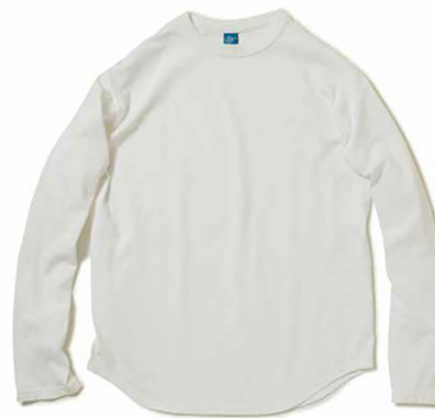
item name. L/S ROUND TEE style. GOLT1711 color. WHITE, METALGRAY, P-BLACK, P-NAVY, P-MUSTARD, P-PERSIMMON, P-SUNNY GREEN ssize. S, M, L price. ¥5,500 +tax