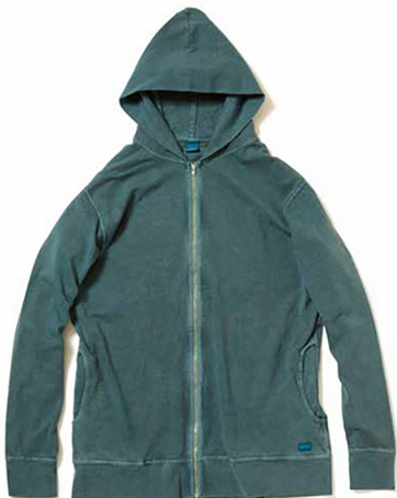
item name. ZIP TEE PARKA style. GOLT1303 color. METALGRAY, P-BLACK, P-NAVY, P-SLATE, P-SAGE, P-BORDEAUX, P-BANANA, P-SMOKY GREEN ssize. S, M, L price. ¥7,600 +tax