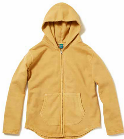
Item name. ROUGH ZIP HOOD SWEAT style. GOBW1706 color. METALGRAY, P-BLACK, P-NAVY, P-MUSTARD, P-TURQUOISE, P-PERSIMMON ssize. S, M, L price. ¥14,500 +tax