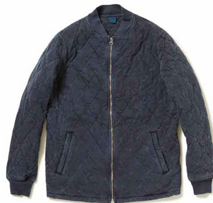
item name. QUILT SKY LINER JKT style. GOBW1707 color. P-BLACK, P-NAVY, P-BORDEAUX, P-SAGE, P-SMOKY GREEN ssize. S, M, L price. ¥18,000 +tax