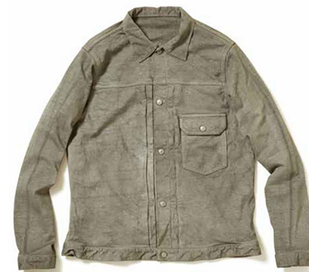
item name. HVY JERSEY G-JAN style. GOLT1604 color. P-NAVY, P-GRAY, P-BORDEAUX, P-SMOKY GREEN ssize. S, M, L price. ¥18,800 +tax