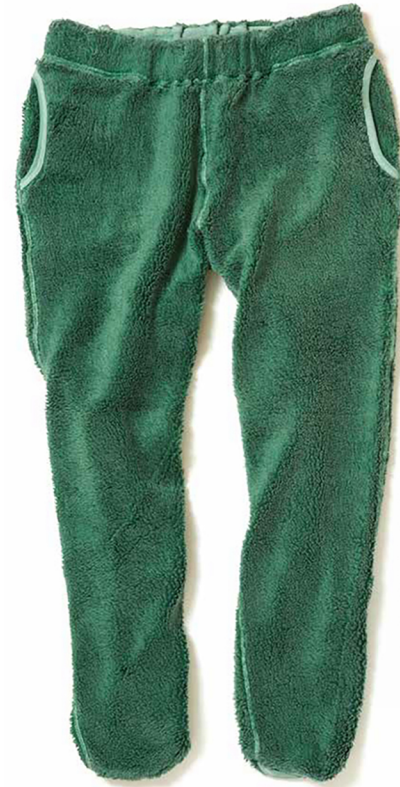
item name. BOA PANTS style. GOPT1508 color. P-NAVY, P-SAGE, P-BORDEAUX, P-TURQUOISE, P-SMOKY GREEN ssize. S, M, L price. ¥17,800 +tax