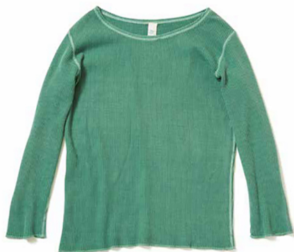
item name. BOATNECK L/S THERMAL TEE style. GOLT1717 color. WHITE, P-NAVY, P-GRAY, P-SMOKY GREEN, P-PINK, P-PERSIMMON size. ONE price. ¥4,900 +tax