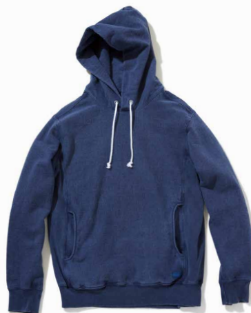
item name. HVY PO HOOD SWEAT material. COTTON 100% [13OZ FRENCH TERRY] style. GOBW-1509C color. [WASHED] WHITE style. GOBW-1509P color. [PIGMENT DYE] P-BLACK, P-NAVY, P-F.RED, P-DK.GREEN, P-MARINE BLUE material. COTTON 77%, POLYESTER 18%, RAYON 5% [13OZ FRENCH TERRY] style. GOBW-1509C color. [YARN DYE] METAL GRAY size. M, L price. ¥14,500 +tax