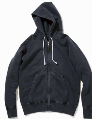
item name. RAGLAN ZIP HOOD SWEAT material. COTTON 100% [9OZ FRENCH TERRY] style. GOBW-502P color. [PIGMENT DYE] P-BLACK, P-NAVY, P-NATURAL, P-BORDEAUX, P-F.RED, P-SLATE material. COTTON 79%, POLYESTER 17%, RAYON 4% [9OZ FRENCH TERRY] style. GOBW-502C color. [YARN DYE] METAL GRAY size. S, M, L price. ¥13,800 +tax