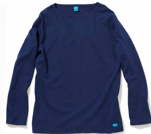
item name. MEN'S L/S BOAT NECK TEE material. COTTON 100% [60Z JERSEY] style. GOLT-1503C color. [WASHED] WHITE style. GOLT-1503C color. [REACTIVE DYE] BLACK, NAVY, RED, OLD GOLD material. COTTON 100% [70Z MOCK TWIST] style. GOLT-1503C color. [YARN DYE] METAL GRAY size. M, L price. ¥5,500 +tax