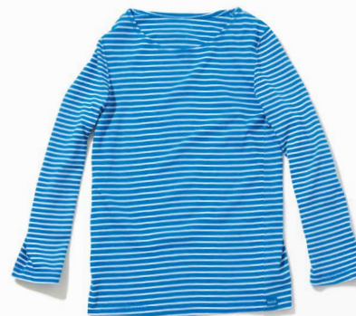
item name. LADY'S L/S BORDER BOAT NECK TEE material. COTTON 68%, POLYESTER 32% [6OZ JERSEY] style. GOLT-1504C color. [REACTIVE DYE] WHITE/WHITE, BLACK/WHITE, NAVY/WHITE, RED/WHITE, BLUE/WHITE, FOREST/WHITE size. ONE price. ¥6,400 +tax