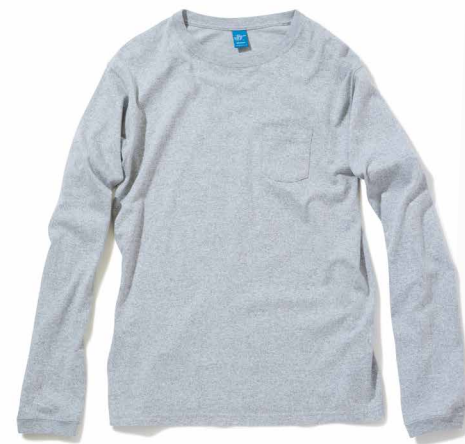
item name. L/S POCKET TEE material. COTTON 100% [60Z JERSEY] style. GOLT-1306C color. [WASHED] WHITE style. GOLT-1306P color. [PIGMENT DYE] P-BLACK, P-NAVY, P-SLATE material. COTTON 90%, RAYON 10% [60Z MOCK TWIST] style. GOLT-1306C color. [YARN DYE] METAL GRAY size. S, M, L price. ¥5,200 +tax