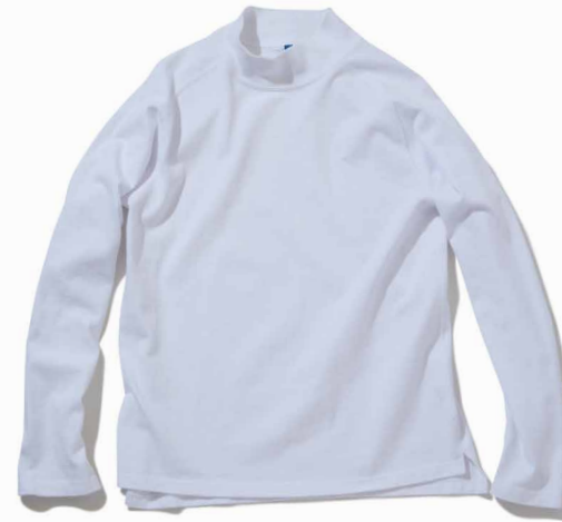
item name. HVY JERSEY L/S MOCK NECK material. COTTON 100% [90Z HEAVY JERSEY] style. GOLT-1510C color. [WASHED] WHITE style. GOLT-1510P color. [PIGMENT DYE] P-BLACK, P-NAVY, P-ASH, P-BANANA, P-F.RED size. M, L price. ¥6,900 +tax