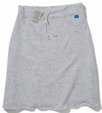
item name. STONE HEATHER SWEAT SKIRT material. COTTON 98%, POLYESTER 2% [9OZ STONE HEATHER] style. GOSK-1505C color. [YARN DYE] NATURAL size. ONE price. ¥6,600 +tax