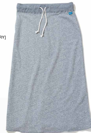
item name. SWEAT MAXI SKIRT material. COTTON 100% [9OZ FRENCH TERRY] style. GOSK-1401P color. [PIGMENT DYE] P-NAVY, P-NATURAL, P-SLATE, P-SAGE, MARINE BLUE material. COTTON 79%, POLYESTER 17%, RAYON 4% [9OZ FRENCH TERRY] style. GOSK-1401C color. [YARN DYE] METAL GRAY size. ONE price. ¥7,400 +tax