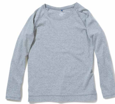
item name. LADY'S L/S RAGLAN TEE material. COTTON 100% [6OZ JERSEY] style. GOLT-1501C color. [WASHED] WHITE style. GOLT-1501P color. [PIGMENT DYE] P-NAVY, P-NATURAL, P-F.RED, P-SLATE, P-VIOLET material. COTTON 90%, RAYON 10% [6OZ MOCK TWIST] style. GOLT-1501C color. [YARN DYE] METAL GRAY size. ONE price. ¥5,600 +tax