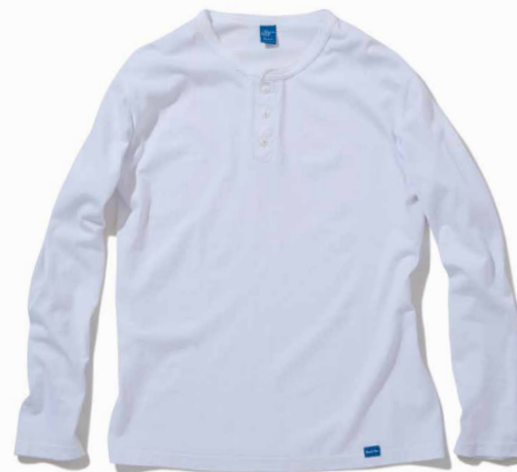
item name. L/S HENLEY TEE material. COTTON 100% [60Z JERSEY] style. GOLT-1601C color. [WASHED] WHITE style. GOLT-1601P color. [PIGMENT DYE] P-BLACK, P-NAVY, P-F.RED, P-ASH size. S, M, L price. ¥5,900 +tax