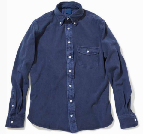
item name. L/S PIQUE B/D SHIRTS material. COTTON 100% [6OZ PIQUE] style. GOLT-1302C color. [WASHED] WHITE style. GOLT-1302P color. [PIGMENT DYE] P-BLACK, P-NAVY, P-SLATE, P-ASH, P-BORDEAUX size. S, M, L price. ¥11,800 +tax