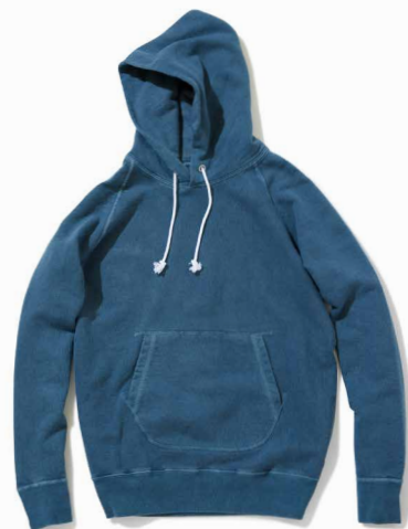
item name. RAGLAN P/O HOOD SWEAT material. COTTON 100% [9OZ FRENCH TERRY] style. GOBW-1203P color. [PIGMENT DYE] P-BLACK, P-NAVY, P-NATURAL, P-F.RED, P-SLATE material. COTTON 79%, POLYESTER 17%, RAYON 4% [9OZ FRENCH TERRY] style. GOBW-1203C color. [YARN DYE] METAL GRAY size. S, M, L price. ¥12,000 +tax