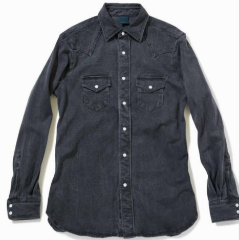
item name. HVY JERSEY L/S WESTERN SHIRTS material. COTTON 100% [9OZ HVY JERSEY] style. GOLT-1511C color. [WASHED] WHITE style. GOLT-1511P color. [PIGMENT DYE] P-BLACK, P-NAVY size. M, L price. ¥13,800 +tax style. GOLT-1511I color. [INDIGO DYE] INDIGO size. M, L price. ¥15,100 +tax style. GOLT-1511S color. [INDIGO DYE+SHAVE] INDIGO SHAVE size. M, L price. ¥16,900 +tax