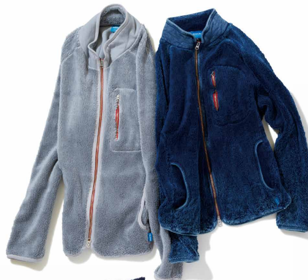
item name. BOA FREEDOM JKT material. OUT SIDE COTTON 100% IN SIDE COTTON 55%, POLYESTER 45% style. GOBW-1506C color. [REACTIVE DYE] WHITE, GRAY, NAVY, RED, ROYAL size. S, M, L price. ¥17,800 +tax style. GOBW-1506IS color. [INDIGO DYE + SHAVE] INDIGO SHAVE size. S, M, L price. ¥20,800 +tax