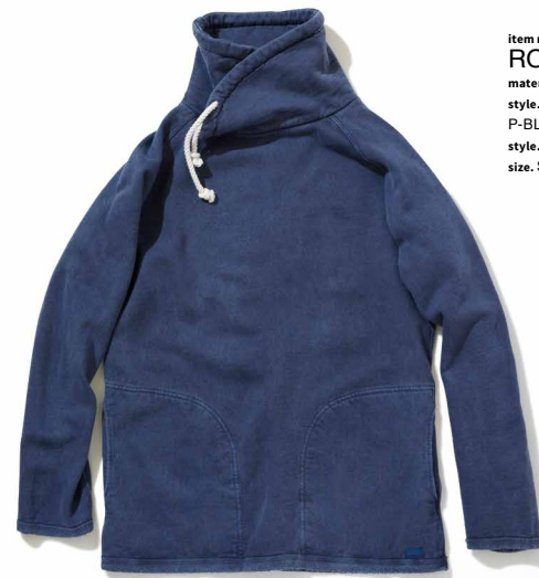
item name. ROLL NECK SWEAT material. COTTON 100% [90Z NAP FLEECE] style. GOBW-1305P color. [PIGMENT DYE] P-BLACK, P-NAVY, P-SLATE, P-BORDEAUX style. GOBW-1305C color. [YARN DYE] METAL GRAY size. S, M, L price. ¥9,500 +tax