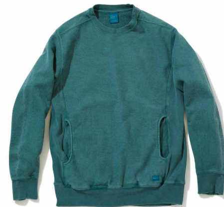
item name. HVY CREW SWEAT material. COTTON 100% [13OZ FRENCH TERRY] style. GOBW-1508C color. [WASHED] WHITE style. GOBW-1508P color. [PIGMENT DYE] P-BLACK, P-NAVY, P-F.RED, P-DK.GREEN, P-MARINE BLUE material. COTTON 77%, POLYESTER 18%, RAYON 5% [13OZ FRENCH TERRY] style. GOBW-1508C color. [YARN DYE] METAL GRAY size. M, L price. ¥12,700 +tax