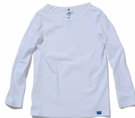
item name. LADY'S L/S BOAT NECK TEE material. COTTON 100% [6OZ JERSEY] style. GOLT-1503C color. [WASHED] WHITE [REACTIVE DYE] BLACK, NAVY, RED, OLD GOLD material. COTTON 100% [7OZ MOCK TWIST] style. GOLT-1503C color. [YARN DYE] METAL GRAY size. ONE price. ¥5,500 +tax