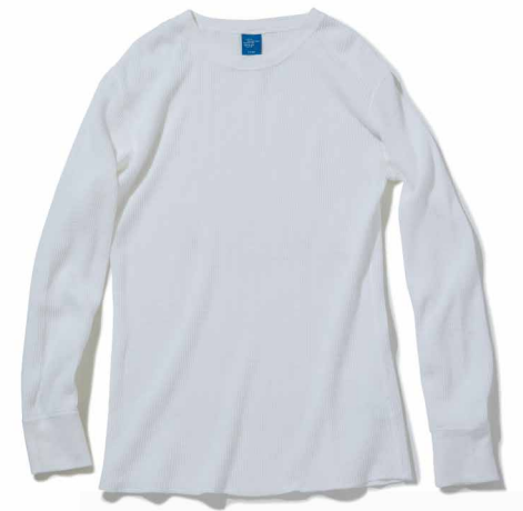
item name. L/S THERMAL TEE material. COTTON 100% [60Z THERMAL] style. GOLT-1202C color. [WASHED] WHITE style. GOLT-1202P color. [PIGMENT DYE] P-BLACK, P-NAVY, P-VIOLET, P-SLATE, P-ASH size. S, M, L price. ¥5,400 +tax