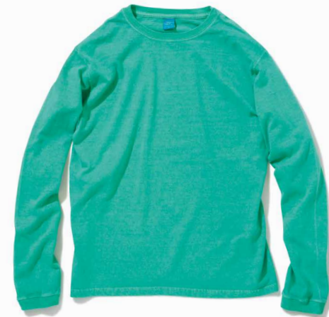
item name. L/S CREW TEE material. COTTON 100% [5.5OZ JERSEY] style. GOLS-802C color. [WASHED] WHITE style. GOLS-802P color. [PIGMENT DYE] P-BLACK, P-NAVY, P-NATURAL, P-F.RED, P-ASH, P-BANANA, P-KELLY size. S, M, L price. ¥4,500 +tax