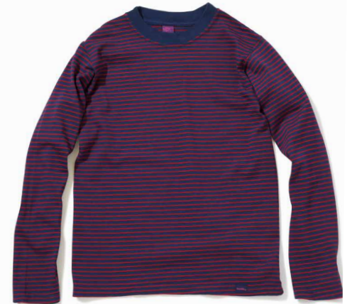
item name. L/S BORDER TEE material. COTTON 68%, POLYESTER 32% [5.5OZ JERSEY] style. GOLS-901C color. [WASHED] WHITE/WHITE style. GOLS-901C color. [REACTIVE DYE] BLACK/WHITE, NAVY/WHITE, BLUE/WHITE style. GOLS-9012 color. [TWICE DYE] NAVY/LIME, NAVY/HOT PINK size. S, M, L price. ¥5,400 +tax