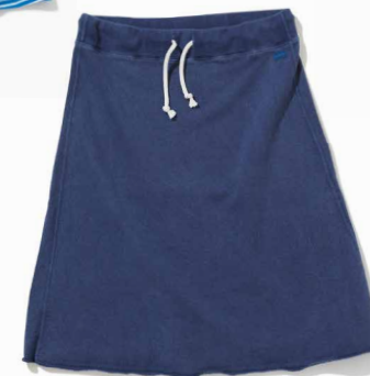
item name. SWEAT SKIRT material. COTTON 100% [9OZ FRENCH TERRY] style. GOSK-1301P color. [PIGMENT DYE] P-NAVY, P-NATURAL, P-SLATE, P-SAGE, MARINE BLUE material. COTTON 79%, POLYESTER 17%, RAYON 4% [9OZ FRENCH TERRY] style. GOSK-1301C color. [YARN DYE] METAL GRAY size. ONE price. ¥6,600 +tax