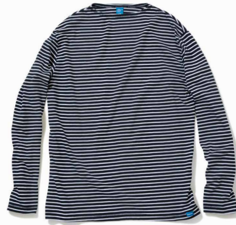
item name. MEN'S L/S BORDER BOAT NECK TEE material. COTTON 68%, POLYESTER 32% [6OZ JERSEY] style. GOLT-1504C color. [WASHED] WHITE/WHITE style. GOLT-1504C color. [REACTIVE DYE] BLACK/WHITE, NAVY/WHITE, RED/WHITE, BLUE/WHITE, FOREST/WHITE size. M, L price. ¥6,400 +tax