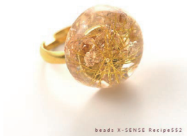
beads X-SENSE Recipe552