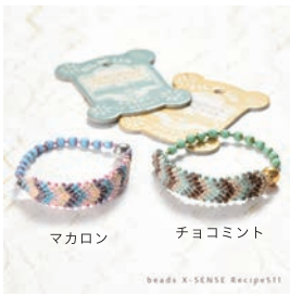
サイズ：手首周り 16cm テクニック：マクラメ 制作時間の目安：約 2～3 時間