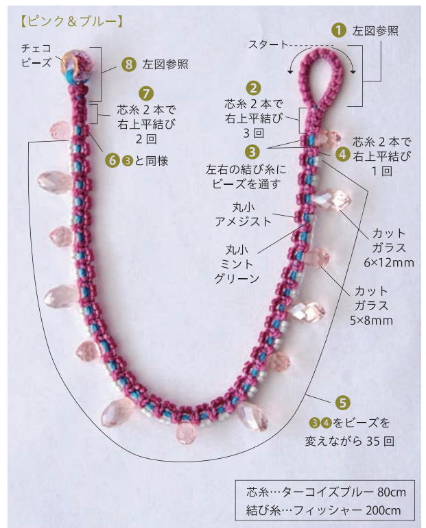
芯糸…ターコイズブルー 80cm 結び糸…フィッシャー 200cm