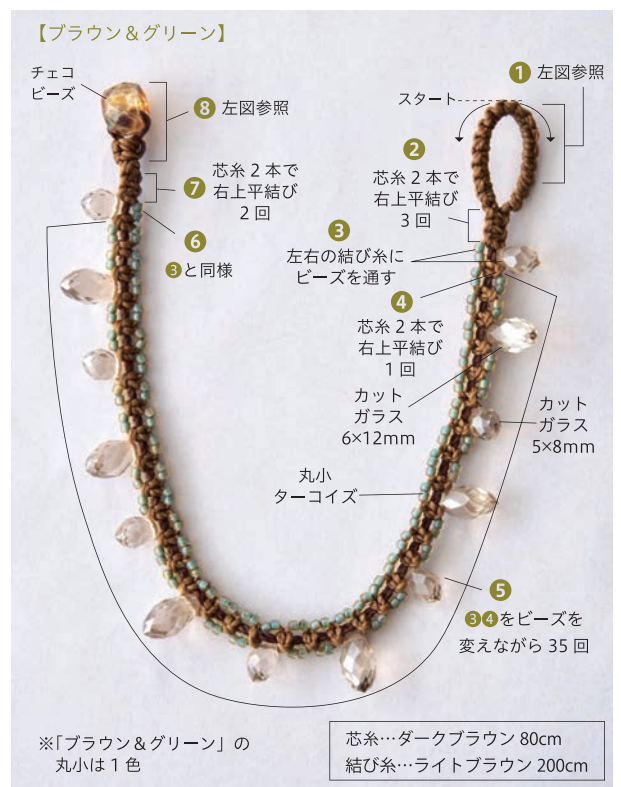
芯糸…ダークブラウン 80cm 結び糸…ライトブラウン 200cm