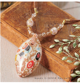
サイズ：約 54cm+ 留め具 テクニック：テグス通し、ひも留め 制作時間の目安：1 時間