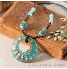
サイズ：約 52cm+ 留め具 テクニック：テグス通し 制作時間の目安：1.5 時間