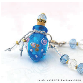
beads X-SENSE Recipe#-5186