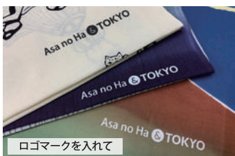
ロゴマークを入れて