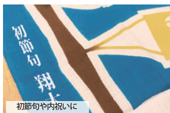
初節句や内祝いに