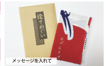
メッセージを入れて