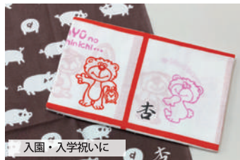
入園・入学祝いに