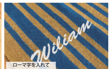
ローマ字を入れて