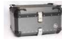
ヘアラインダークグレー CCX650HDG