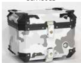
カモフラージュブラックグレー CCX450CBG