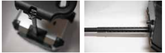
引き伸ばし (45Lサイドオープン 10段、その他 7段)