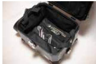
インナー底面ポケット