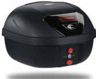
URBAN S40 / 40L アーバン S40

フルフェイスヘルメット+レインウエア等を収納可能。 窒素インジェクション成型生産で高剛性です。 どんな車種カラーにも合わせやすいホワイトトップリッド。 ベースプレート及び汎用取り付け部品一式とカギ2本が付属。