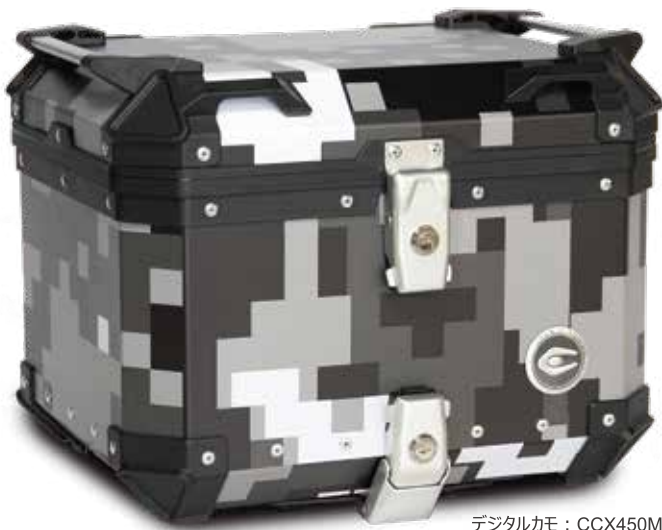
デジタルカモ : CCX450MG