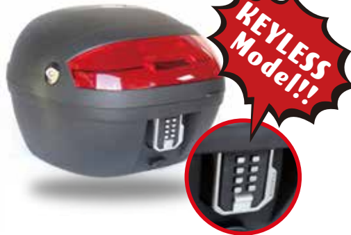
S30 キーレス S30KL/30L S30KL エスサンマルキーレス

軽量かつコンパクトながら、使いやすいクーケースの基本性能を兼ね備えたスタンダードモデル。 インナーライナーとベースプレート及び汎用取り付け部品一式とカギ2本が付属。