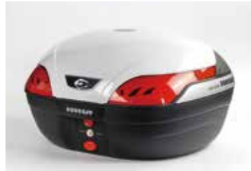
ASTRA S48 / 48L アストラ S48 CN40110

一般的なフルフェイスヘルメットを1個収納可能。 軽量かつコンパクトながら、クーケースの基本性能を備えるエントリーモデルです。インナーライナーなしの設定も用意。 ベースプレート及び汎用取り付け部品一式とカギ2本が付属。