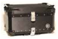
ヘアラインブラック CCX650HB