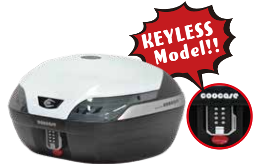
ASTRA S48 キーレス /48L アストラ S48 キーレス CKL40110

大型バイクロングツーリング向けモデル。 一般的なオープンフェイスヘルメットなら2個収納が可能。 どんな車種カラーにも合わせやすいホワイトトップリッドです。 ベースプレート及び汎用取り付け部品一式とカギ2本が付属。