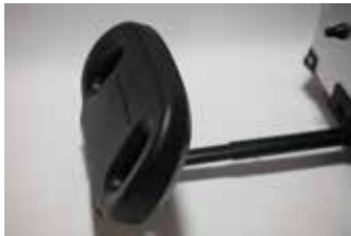
背もたれ角度調整