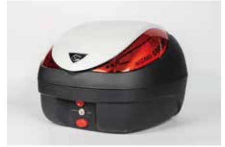
WIZARD V36 / 36L ウィザード V36 CN30110

設定したパスワードで解錠する キーレスタイプです。 一般的なヘルメットプラスアルファを収納できる容量で、大型リフレクションオーナメントを採用し、夜間走行も安心。軽量で通勤・通学・ビジネスユースや自転車にも最適。 ベースプレート及び汎用取り付け部品一式とパスワード設定用