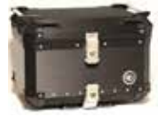
ヘアラインブラック CCX550HB