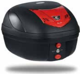
VIVO S28/ 28L CC1001 ヴィボ S28

軽量かつコンパクトながら、使いやすいクーケースの基本性能を兼ね備えたスタンダードモデル。 インナーライナーとベースプレート及び汎用取り付け部品一式とカギ2本が付属。