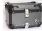
ヘアラインダークグレー CCX550HDG