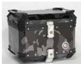
カモフラージュブラック CCX450CB