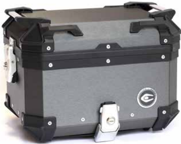
ヘアラインダークグレー CCX300HDG