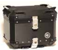
ヘアラインブラック CCX450HB