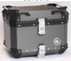
ヘアラインダークグレー CCX450HDG