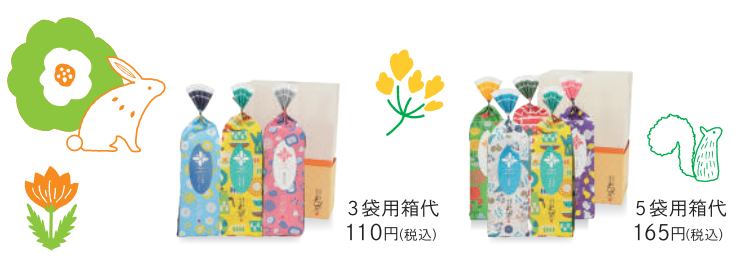
3袋用箱代 110円 (税込)

■B3222 ギフト 80個入り 3,564 円 (税込) 麻布あげ だし醤油 / 小丸あげ 胡麻塩 / 小丸あげ 醤油 / 砂糖付き梅あられ / もみの木 / 海老おかし / おこげ醤油 / 蝶々 / チューリップ / 富士山 / クッキー (てんとう虫・ブタ・小人・フクロウ・カギ・ウサギ・ダーラナホース・小鳥・ゾウ)