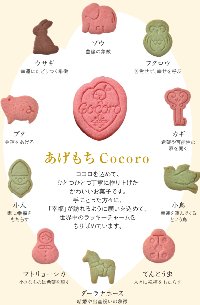
ウサギ 幸運にたどりつく象徴