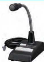
ベース用 スタンドマイクロホン KMC-53