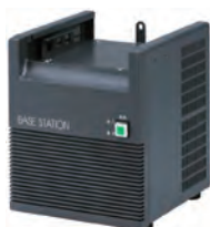
ベース用 スピーカー付き電源 KBS-1