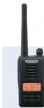
デジタル簡易無線 携帯型登録局対応無線機 D503シリーズ