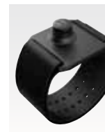
アームバンド PMLN5232 近日発売