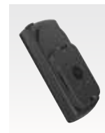
マグネチッククリップ PMLN5231 近日発売