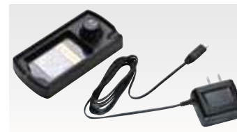
シングル充電器セット PMPN4058 5,000円(税別)