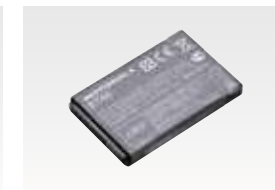
リチウムイオン電池 (BT60 1,130mAh) HKNN4014 本体価格4,000円(税別)