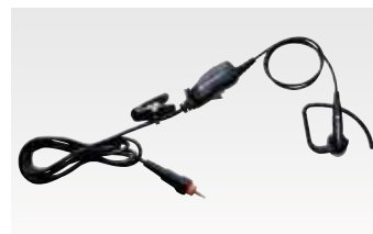
業務用カナル型イヤホンマイク (S/M/Lイヤピース付き) PMLN7081 本体価格5,400円(税別)