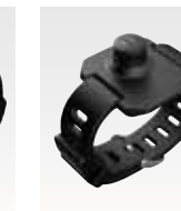
リストバンド PMLN5233 近日発売