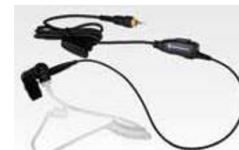
アコースティックチューブ付きイヤホンマイク HKLN4487 本体価格6,300円(税別)