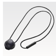
ネックストラップ PMLN5230 本体価格1,000円(税別)