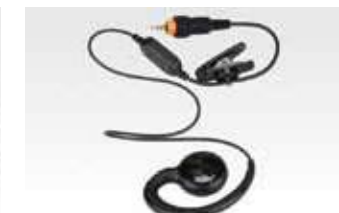
VOXマイク付きショートコードイヤホン HKLN4437 本体価格4,000円(税別)