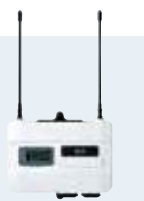
特定小電力中継装置 FTR-308