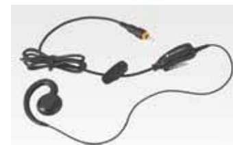
フレックス型イヤホンマイク HKLN4455 本体価格4,400円(税別)