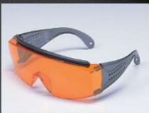
山本工学製 UV保護メガネ