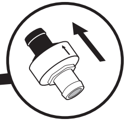
シュパーブ・フォース 取付位置