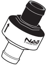
シュパーブ・フォース本体