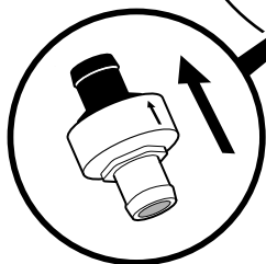
ブリーザーホース

ダイレクトイグニッションと 干渉しない位置に シュパーブ・フォースを 取り付けます。