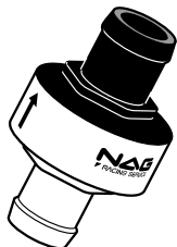
シュパーブ・フォース本体