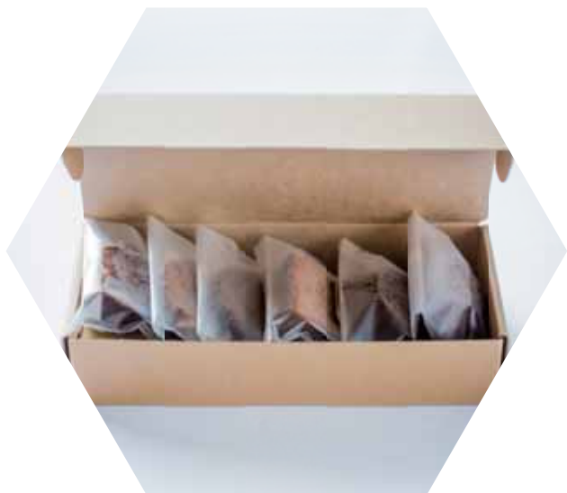
焼き菓子 6個入り ¥ 2,160 (税込)