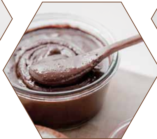
PÂTE À TARTINER ショコラ・スプレッド