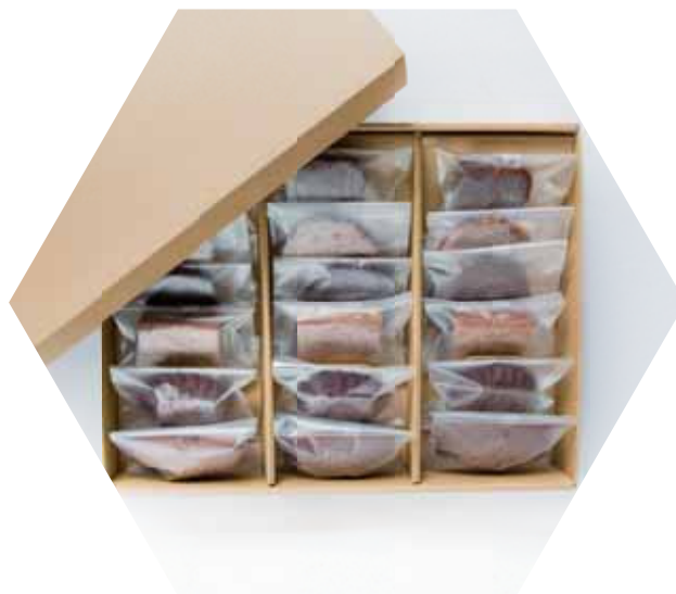
焼き菓子 18個入り ¥ 5,400 (税込)