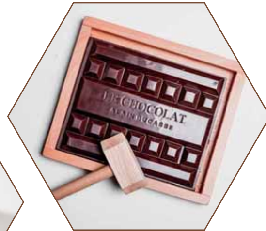
BLOC À CASSER ブロック・ド・ショコラ