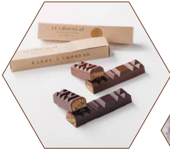
BARRE À CROQUER ショコラバー