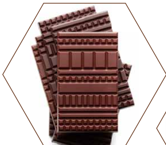
GRAND CRU & ORIGINE クリュデクセプション&オリジン

カカオ豆の産地の豊かさを物語る、種類豊富な「オリジン」。昔ながらの製法への敬意を込めた「マンディアン」。 ショコラへの真摯な愛情を美味しく、個性豊かに表現した「トラディション」。 どれもユニークなデザインと、はっきりと主張するストレートな味わいが魅力です。