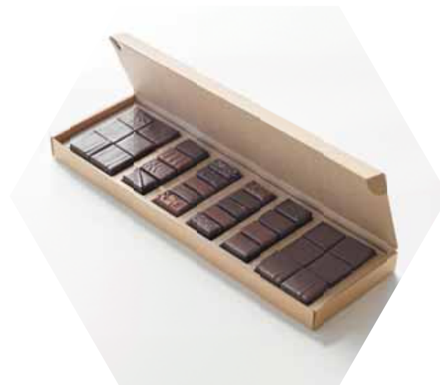
ボンボン・ショコラ 30個入り ¥ 11,880 (税込)