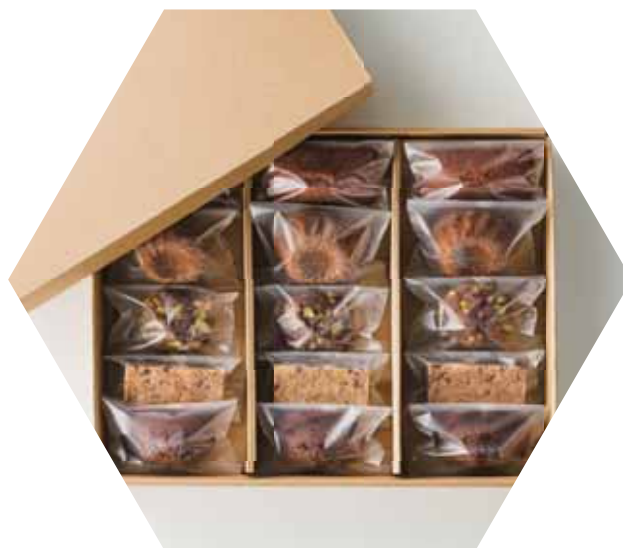
焼き菓子 15個入り ¥ 5,400 (税込)