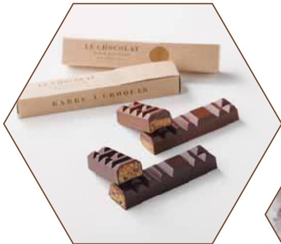
BARRE À CROQUER ショコラバー