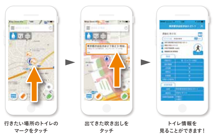
行きたい場所のトイレのマークをタッチ 出てきた吹き出しをタッチ トイレ情報を見ることができます！