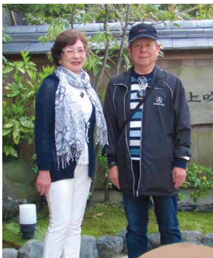
ストーマ歴41年 家内と温泉旅行

私は、セルフケアに「参考書はあつても教科書はない」が信念です。教科書は自分の生活に合ったものを自分自身で