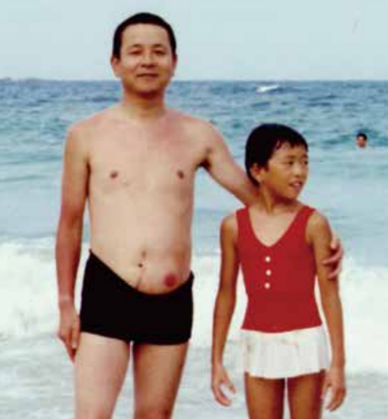
ストーマ歴1年 家族で海へ旅行に。

当初、悪臭やオナラの音への羞恥心もあり、相手に不快な思いをさせるのではないかと不安がありました。オナラも結構大きな音があります。自分の意志では止められません。対面するときなどは恥ずかしい思いもしましたが、思い切って「直腸がんによる人工肛門造設」という私の状況をお話すると、「若いのに気の毒に」と気にかけていただいたり、