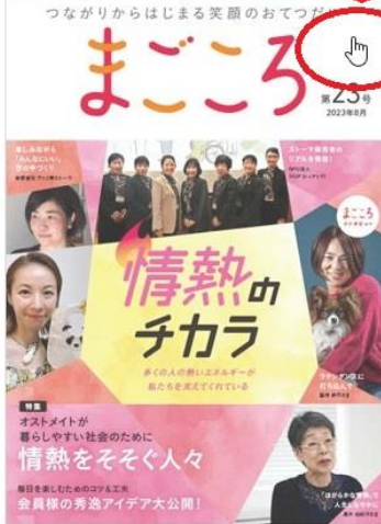
最新刊 第23号 2023年8月発行