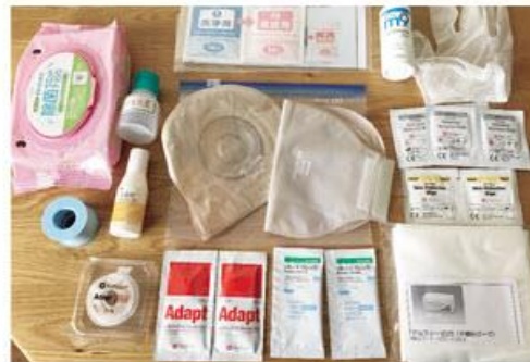
機内持ち込み荷物

また、ハサミは機内に持ち込むことができません。あらかじめ必要な大きさにカットしておきましょう。