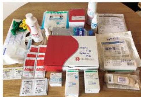
キャリーケース荷物

欠航など不測の事態に備えて、宿泊日数分よりも多めに装具や補助用品を持っていきましょう。