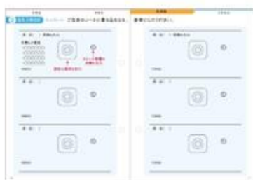
面板の溶け具合、 ストーマの周辺について記入する 装具交換日記テンプレート

こちらでは快適なストーマライフのために便利なテンプレートや、持っている安心なガイド情報などを掲載しております。画像をクリックすると情報が表示されますので、プリントアウトするなどしてご利用ください。