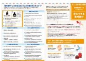
ストーマについての説明: 各国語