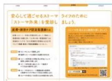
ストーマ外来 = JWOCM 外来検索 JWOCM 外来検索はこちらから