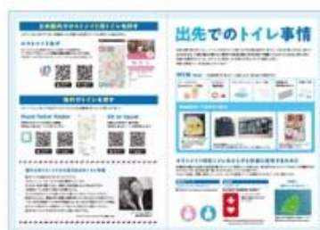
外出時のトイレ、海外のトイレを探す