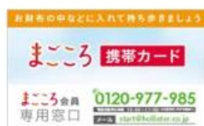
使用装具番号、連絡先などを記入する 携帯カード