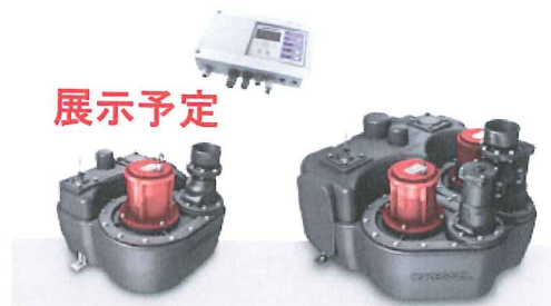
即排君 II < Lifting station ≒ ビルピット