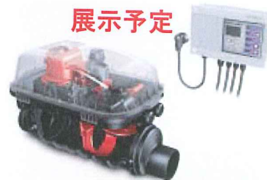
豪雨時にトイレ・流しなどを強制排水