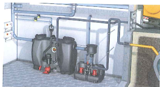
残渣・油脂を自動排水