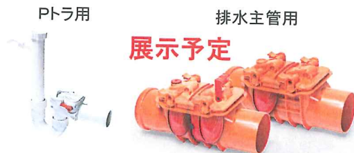
排水管からの雨水逆流を防止