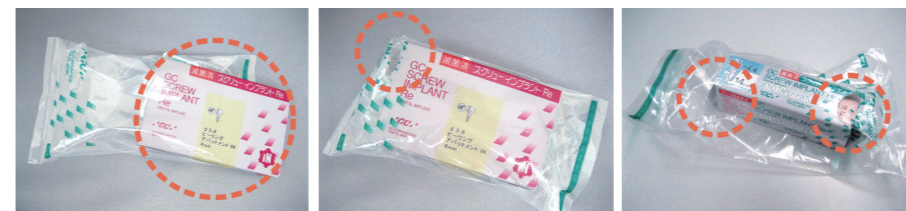
ヒートシール包装が開封された製品 ヒートシール包装が破損、汚損している製品 ヒートシール包装内の箱が汚損している製品