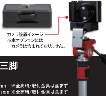
カメラ設置イメージ ※本オプションには カメラは含まれておりません。

三脚の雲台の投光器取付金具にアタッチメントを取り付けるとカメラ、ビデオカメラ、レーザ距離計等を装着できて便利です。本製品は、FireFighting 三脚とは別売です。