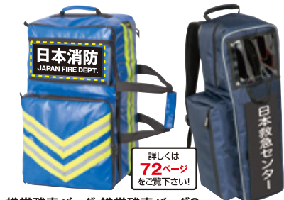
携帯酸素バッグ・携帯酸素バッグS