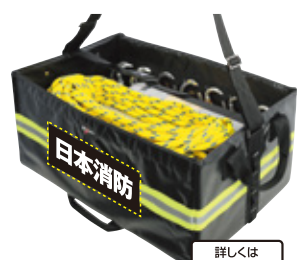
クイックアタック

下記商品にも反射プリント(110×250mm)を付けられます。 ※マジックテープ式で着け外し可能です。