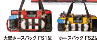
大型ホースバッグ FS1型 ホースバッグ FS2型