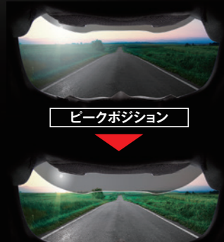
ピークポジション

シェードを跳ね上げ、ピークポジションにすれば、早朝や夕暮れ時の強い日差しなどを抑える効果がある。走行中、目を射る眩しい光を捕らえたら、首を傾ければシェードがクルマのサンバイザーのような役目を果たし、陽がシェードに隠れ視野が守られる。強いコントラストの薄暗い朝など、スモークシールドで全体を暗くするより、広い視野を維持することができる。