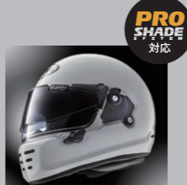
プロシールドシステム (オプション) にも対応

■AR Fog Freeシート (オプション) ラバド・ネオの標準装備シールドに装着可能な防曇シート。曇りやすい時期のライディングでも常にクリアな視界を確保できます。シート自体は特殊加工により熱変形や傷つきに強く、メンテナンスも簡単。曇りを強力に抑えることができます。