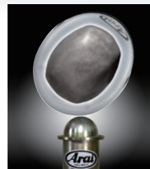
人頭型の四隅は角ばっているため、その箇所への試験が厳しくなる。