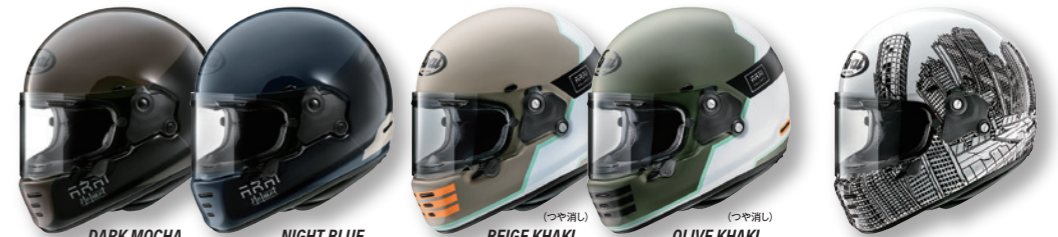
RAPIDE-NEO REACT (リアクト) RAPIDE-NEO OVERLAND (オーバークラント) RAPIDE-NEO ROARS (ロアーズ)