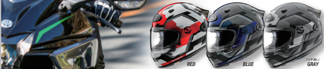
ASTRO-GX FACE (フェイス)