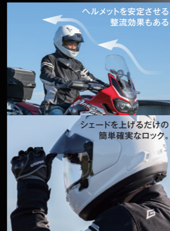
ヘルメットを安定させる 整流効果もある

より低い西日などに対して、シェードを完全に下げなくても対応できるようにミドルピークポジションを設け、ピークポジションとの2ポジションの選択が可能。