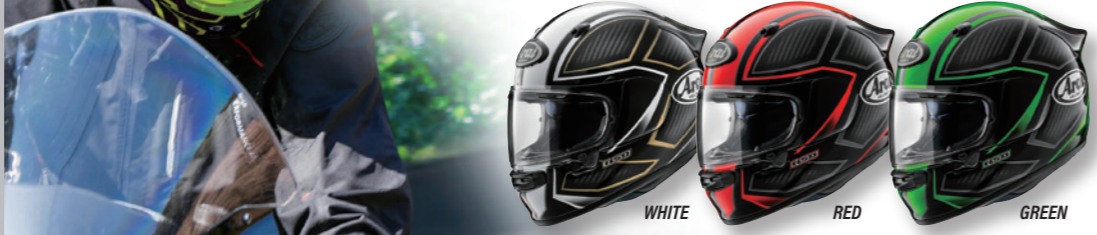
ASTRO-GX SPINE (スパイン)