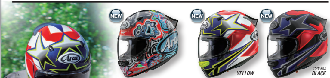
ASTRO-GX JUNGLE 2 (ジャングル2) ASTRO-GX STAR & STRIPE (スター&ストライプ)