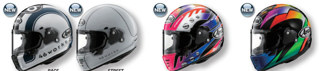
RAPIDE-NEO 46WORKS (46ワークス) RAPIDE-NEO HARADA (ハラダ) RAPIDE-NEO SAKATA (サカタ)