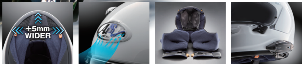
■開口を拡張したスムーズな脱ぎ被り ■フロントロゴダクト・ベンチレーション ■エマーゼンシート付きFCS内装 ■インカムにフィットするフォルム