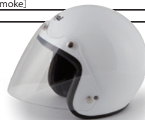
ニューコンペシールド (クリアー) [NEW COMPETITION SHIELD]