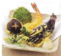
目安温度を設定すれば油の温度を自動でキープ