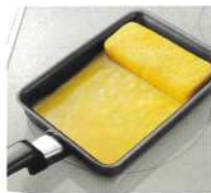
メニュー(卵焼き、焼き物)に合わせて設定火力を自動でキープ

調理モード(左IH) 「卵焼き」「焼き物」 適温調理(右IH) 「揚げ物」(140℃~200℃:10℃きざみ)