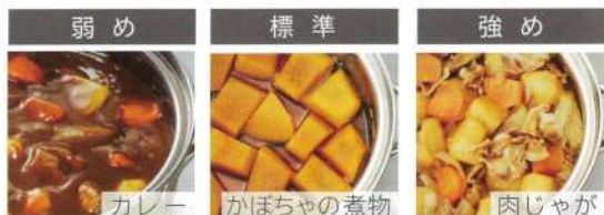
※「煮込み」メニューは、調理物を沸騰させてからご使用ください。※約45分経過すると自動的に通電を停止します。

煮込み加減に合わせて、「弱め」「標準」「強め」の3段階から選んでじっくり煮込めるのでおいしく味がしみ込みます。