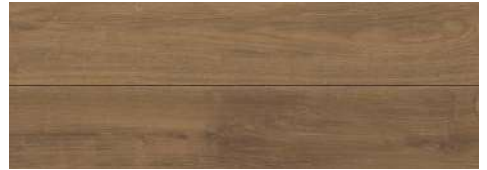
<ブラウンチェスナット柄> TSG-BCST/■

●販売地域により品番が異なります。品番末尾の■には地域品番を表す記号が入ります。 ●該当品番は弊社最寄りの営業所にお問い合わせください。 ●品番が異なる製品を混合して使用はできません。