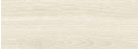
<ホワイトアッシュ柄> TSG-WAST/■