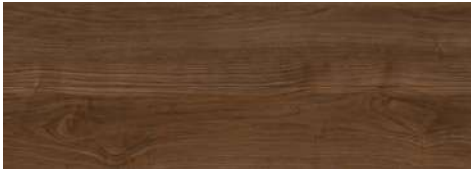
<スモークナット柄> TSG-SNTT/■