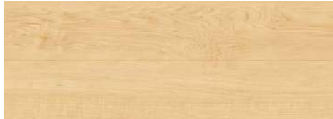
<ハードメープル柄> TSG-HMPT/■