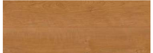
<ブラックチェリー柄> TSG-BCHT/■