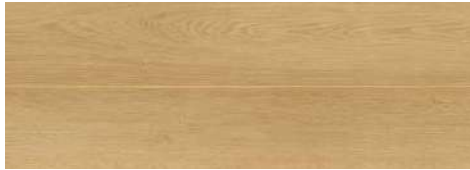
<ナチュラルオーク柄> TSG-NOKT/■