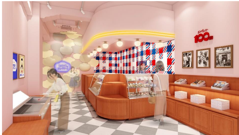
▲ヒロタ 東京・東銀座店イメージ