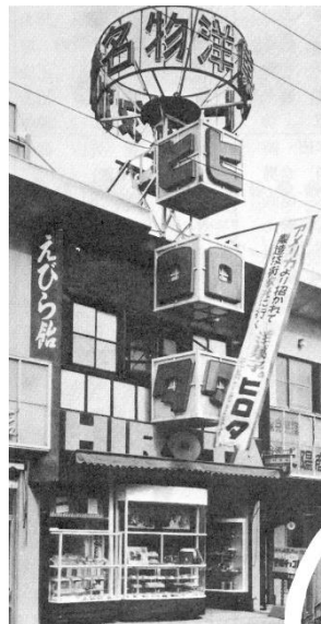
▲設立初期の元町店

洋菓子のヒロタは、1924年10月、創業者である廣田定一が大阪市上福島の自宅を改装し、洋菓子の製造販売をしたことに始まります。1935年にはシュークリームの実演販売ショップをオープン、第二次世界大戦での物資統制による休業などを経て、1948年には神戸の元町に「洋菓子のヒロタ」の礎となる元町店をオープンします。その後、1964年にはシューアイスの開発に成功し、1969年には東京へ進出、1973年にはフランス・パリにも店舗を出店するなど世界展開を試みます。1978年にはシュークリーム生産ラインを自動化するなど、業界を革新するチャレンジを続けてきました。2000年代には経営危機に瀕しながらも多くの方々に支えられ、その後も新商品の開発や、OEM事業、海外輸出、異業種とのコラボなどを積極的に展開し、2024年10月1日に創業100周年を迎えます。