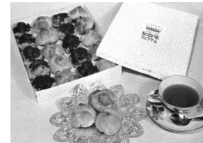
▲(上)パリ エトワール店