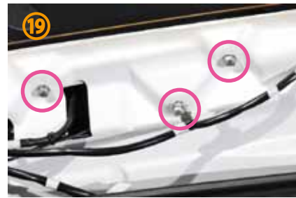
⑲外したボルトは元に戻して下さい。