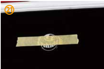
㉑マスキングテープ等で固定すれば作業がしやすくなります。