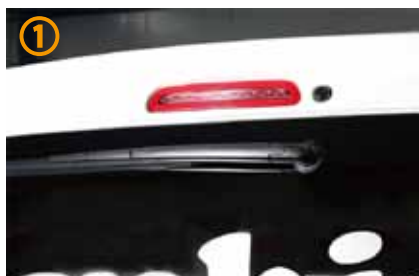
①リアのワイパーを取り外していきま

株式会社 ユーアイ 〒587-0063 大阪府堺市美原区大饗158-1 TEL:072-363-8913/FAX:072-363-8914 MAIL:info@ui-vehicle.com http://www.ui-vehicle.com