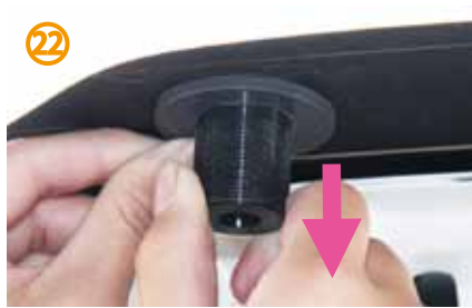
㉒～㉔黒→青→黒の順でパッキンを奥まではめていきます。その際、 本体を引っ張りながら作業を行って下さい。 外側に落下する可能性があります。