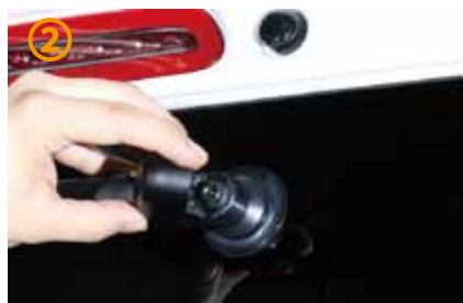
②～③キャップを浮かし、10mm ナットを緩めて下さい。ナットは完全に外さないで下さい。