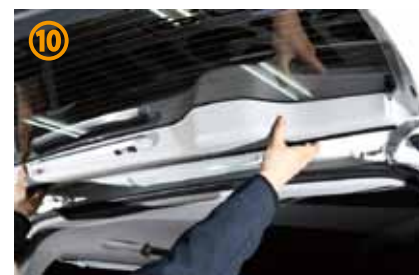
⑩～⑪リアゲート内側より、トリムカバーを外して下さい。