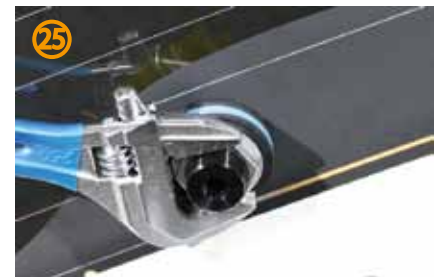
㉕付属のナットで固定して下さい。