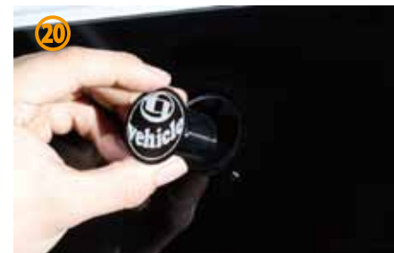
⑳外側からカバーをはめて下さい。