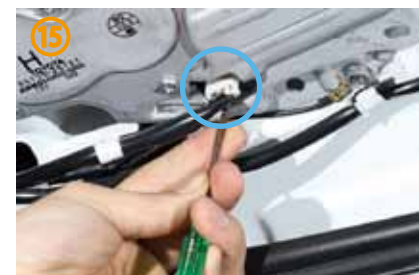
⑮青○部分のカプラーも外して下さい。