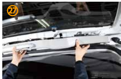
㉗トリムカバーを戻して下さい。