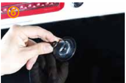
⑥～⑨純正カバーを外し、モンキーレンチでワイパーモーターのナットを外して下さい。