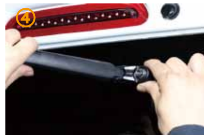
④～⑤ナットが掛かった状態でワイパー本体の根元を前後に引っ張り、ワイパーを取り外して下さい。