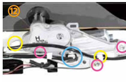
⑫～⑭黄○部分のピンを2カ所、外して下さい。