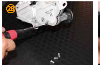
㉘～㉚トリムカバーの浮きが気になる場合はモーターをばらし、ブラケットのみ取付けてから、トリムカバーを戻して下さい。