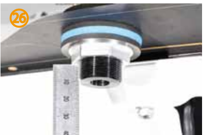
㉖その際、締め過ぎには注意して下さい。 ※ガラスの破損の恐れがあります。 ネジ山が約10mm飛び出している位が目安です。