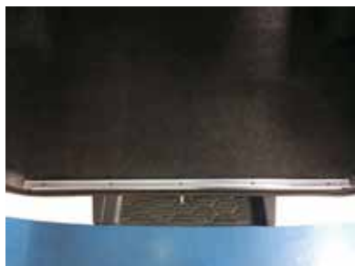
純正エンドパネルを外して下さい。