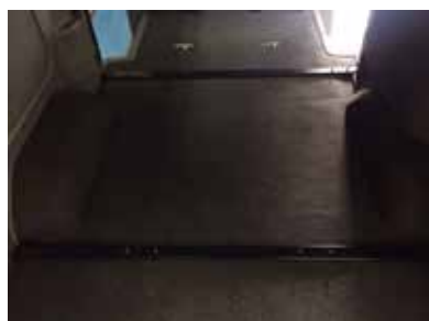
前側と後側のフレームを