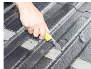
接面のタールを剥がして下さい。