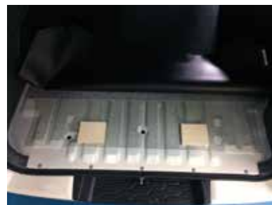
純正カーペットをめくり、付属の木製スペーサーを両面テープなどで固定して下さい。