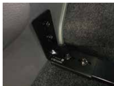
サイドブラケットを使って固定して下さい。