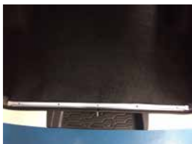
カーペットを元に戻して下さい。