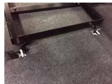
フックブラケットをアンカーバーにひっかけ、付属のナットで固定して下さい。