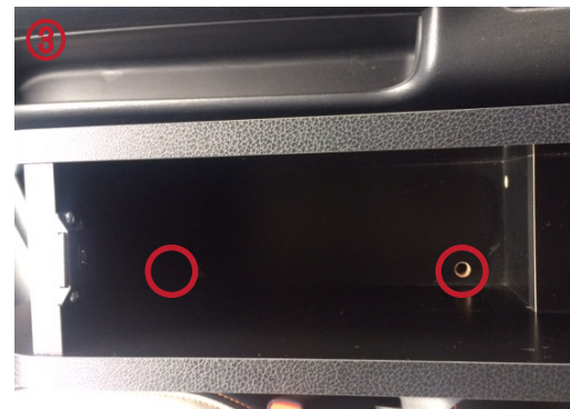
③ 穴の位置をあわせて載せてください。