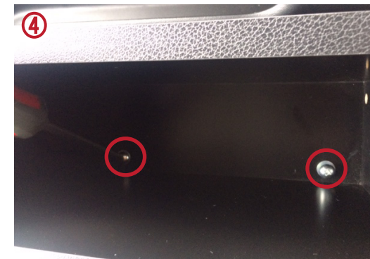
④ 付属の6ミリトラスボルトと平ワッシャーで留めてください。