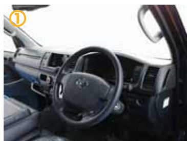
① インストルメントパネルを全て取り外して下さい。全てはめ込みになっています。