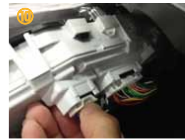
⑩ 画像のようにカプラーのレバーにツメをかけてカプラーを外して下さい。