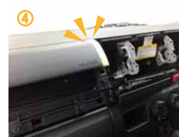
④ マスキングテープ等でパネルに傷がつかないように保護して作業して下さい。