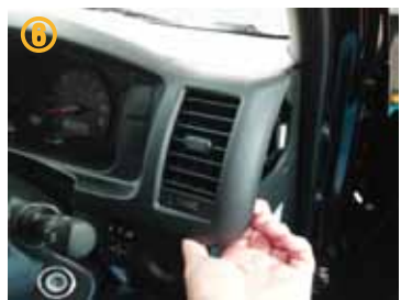
⑥ メーター横のインストルメントパネルを取り外して下さい。