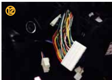
⑫ 取り外した 2 個のカプラーの配線に本品を結線して下さい。(裏面配線図参照)