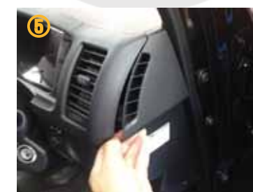
⑤ 運転席側のサイドパネルを取り外して下さい。