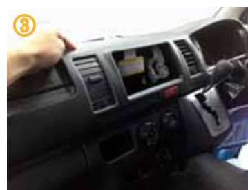
③ インストルメントパネル (メイン部) を取り外します。