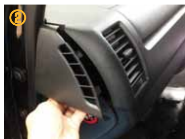
② 助手席側サイドパネルを外して下さい。