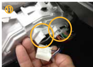
⑪ メーターに接続されている 2 ヶ所共、取り外して下さい。