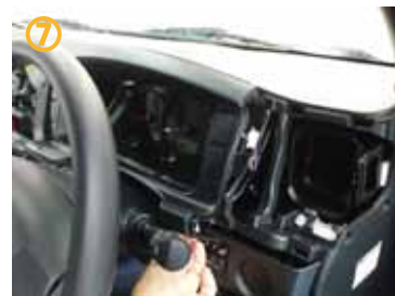
⑦ ウィンカーレバーとワイパーレバーを一番下まで下げて、メーター部分のインストルメントパネルを取り外して下さい。