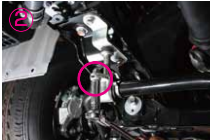
②~⑤純正のスタビ固定ブラケットを外して下さい