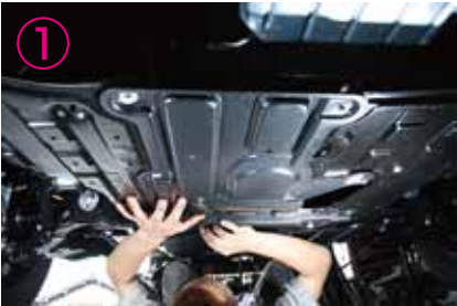
①アンダーカバーを外して下さい

株式会社 ユーアイ 〒587-0063 大阪府堺市美原区大饗158-1 TEL:072-363-8913/FAX:072-363-8914 MAIL:info@ui-vehicle.com http://www.ui-vehicle.com