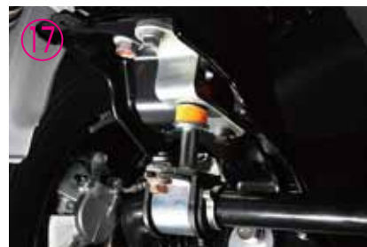
⑮~⑰逆の手順で取り付けていき、最後に全てのネジが緩んでいないかチェックし、完成です。

※本商品とスタビライザーを固定する時は奥側(進行方向前側の短い方の辺)を先に締め、手前側(進行方向後ろ側)を後で締めて下さい。