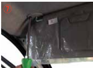
⑦ プラスドライバー#3を使用してサンバイザーを取り外して下さい。