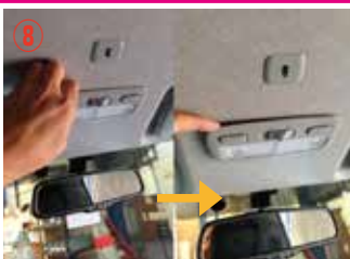
⑧ マップランプのカバーに爪を入れて少し浮かせて下さい。