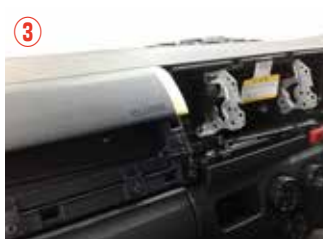
③ インストルメントパネルを取り外した状態です。