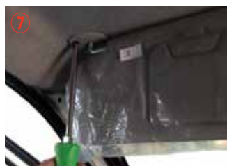
⑦ プラスドライバー#3を使用してサンバイザーを取り外して下さい。