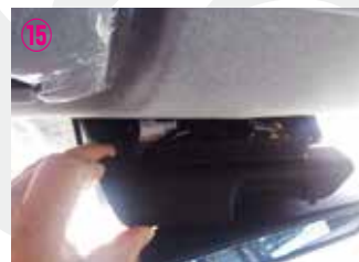
⑮ 上段のカバーのみを取り外して下さい。