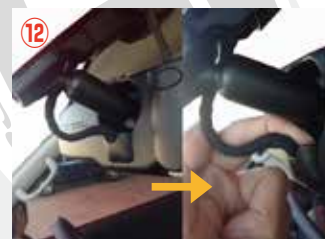
⑫ ルームミラー裏側のコネクターを取り外して下さい。