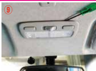
⑨ 小さなドライバーを挟み、ゆっくり外して下さい。