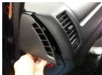
① 助手席側サイドパネルを外して下さい。