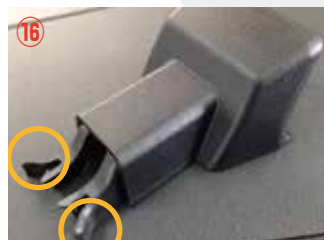
⑯ ○の箇所を押して外します。