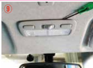
⑨ 小さなドライバーを挟み、ゆっくり外して下さい。