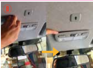
⑧ マップランプのカバーに爪を入れて少し浮かせて下さい。