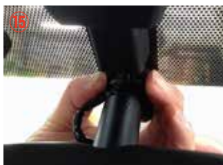
⑮ ラインカバーを取り外して下さい。