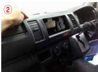
② インストルメントパネル (メイン部) を取り外して下さい。