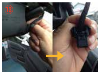
⑬ ミラー裏カプラーをミラーのカバー (黒色) ごと取り外して下さい。