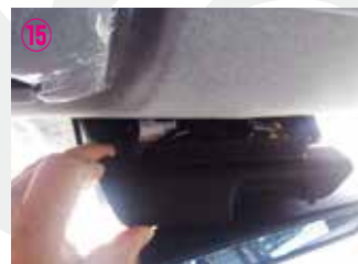
⑮ 上段のカバーのみを取り外して下さい。