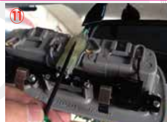
⑪ マップランプのコネクターを取り外して下さい。