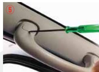
⑤ 小さなドライバーでボルトカバーを取り外して下さい。傷つきやすいので注意して下さい。