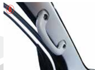
⑥ プラスドライバー#3を使用してアシストグリップを取り外して下さい。