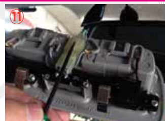
⑪ マップランプのコネクターを取り外して下さい。