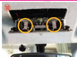
⑩ ○の位置にピンがありますので押さえながら外して下さい。無理やり外すとピンが折れやすいので注意して下さい。