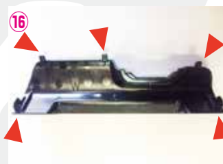
⑯ 三角のピンを折らないように取り外して下さい。