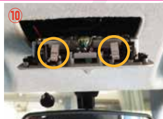
⑩ ○の位置にピンがありますので押さえながら外して下さい。無理やり外すとピンが折れやすいので注意して下さい。