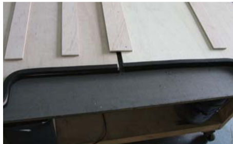
スライドドアのステップトリムに重なる部分に貼って下さい