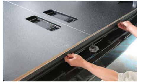
エンドパネル（木製）を純正ステップ トリムの上に入れて下さい。