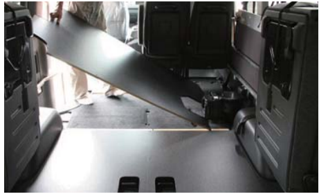
3列目部分の板を敷いて下さい