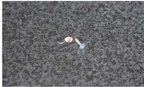
接合部分をビスで固定して下さい