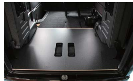
続いて運転席側の板を敷いて下さい