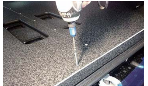
エンドパネル（木製）を 4x50mm ビスで 固定して下さい。