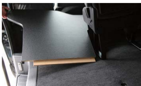
2列目部分の板を敷いて下さい