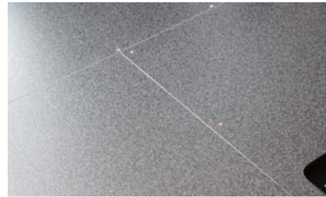
計 16 ケ所の接合部分を同様にビスで固定 して下さい。