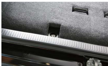
スペアタイヤ脱着用ボルトのカーペットを内側に折り込んで下さい