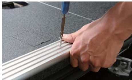
アルミエンドパネルを 3x16mm 丸皿 ステンレスビスで固定して下さい