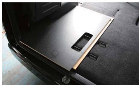
助手席側の板を敷いて下さい