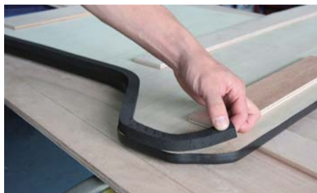
スライドドアステップ部にサンベルカを貼り付けて下さい