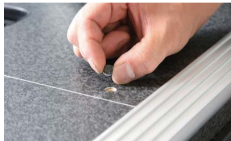
ビス打ち後、床材の切り抜きキャップで フタをして下さい