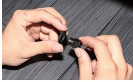
付属の六角ナットにワッシャー（黒）をはめる