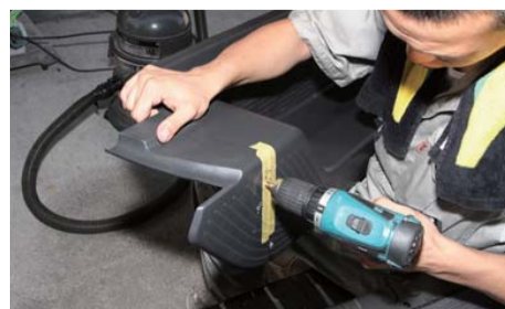
ステップを外し、Φ6mmの穴をあける