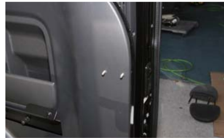
Cピラー内張りを浮かし裏から固定金具をはめ込みます