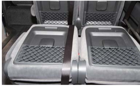
シート背面のアシストグリップを外す