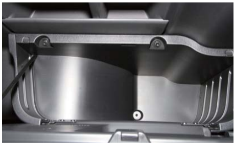
純正ボックスを外す