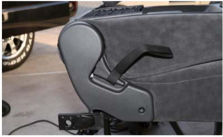
付属のベルト付きレバーに交換する