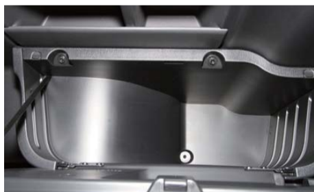
純正ボックスを外す