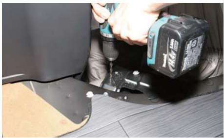
ステップを外し先ほどにマーク部分にΦ9mmの穴をあける