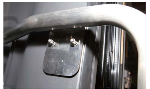
最後にCピラー部分を袋ナットで固定する