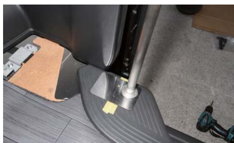
脚部分のステップ穴位置をマークする