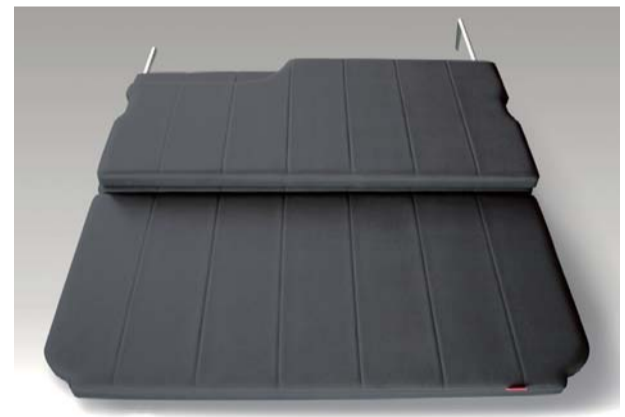
7人乗車時 (ワゴンGLは6人乗車時) 4列目のシートをリクライニングさせ、 その上をベッドキット、 1・2・3列目を活かして7人乗り仕様。 (ワゴンGLは6人乗り仕様)