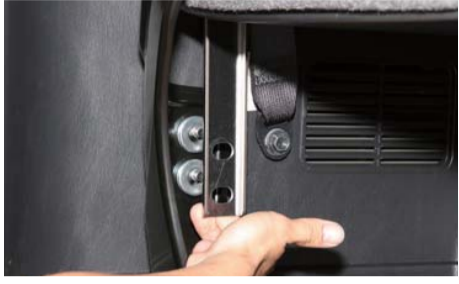
ボディ側に先ずワッシャー（シルバー）を挟む