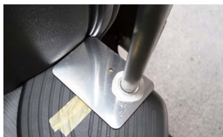
フレーム上部が先ほどのCピラー固定金具にしっかりと当たった状態で脚位置を決める