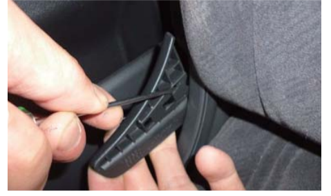
3列目シートの窓側リクライニングレバーを外す