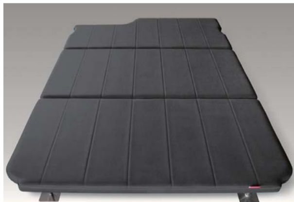
4人乗車時 3・4列目のシートをリクライニングさせ、 その上をベッドキット、 1・2列目を活かして4人乗り仕様。