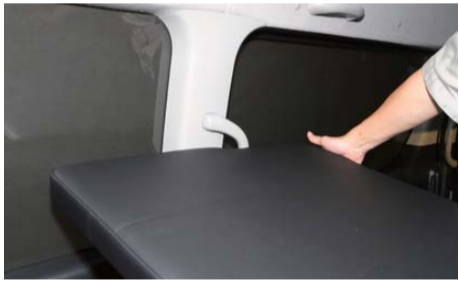
運転席側をフレームに置き、Cピラーサポートグリップを交換しベッドマットを置く