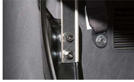
フレームを合わせ、六角ナットを締め固定する