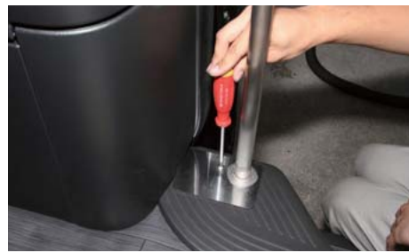
ステップを戻しフレームを合わせ、5mm ボルトで固定する