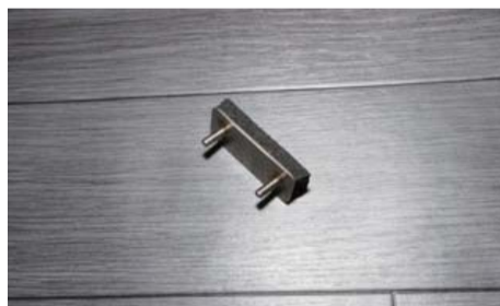
フレーム固定金具