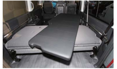
前側のベッドマットから置いていきます