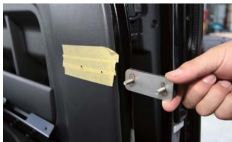
マーキングした部分の内張りにΦ6mmの穴をあける