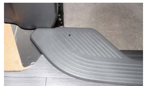
一度ステップを戻し、その下の鉄板に穴位置をマークする