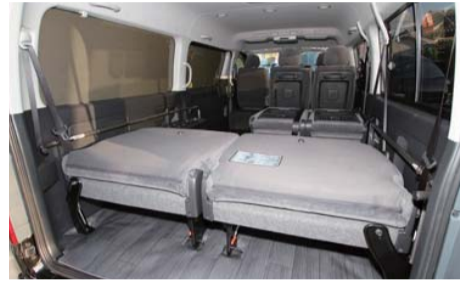
左右フレームを固定し、3rdシートを元に戻す