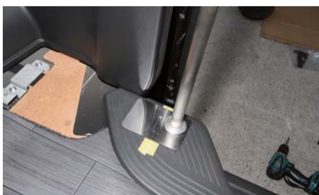
脚部分のステップ穴位置をマークする