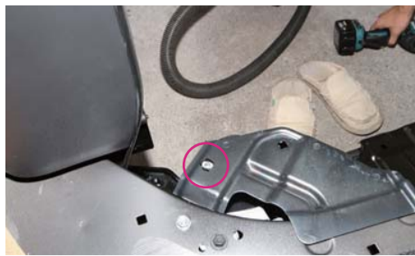
付属の5mm ターンナットをはめ込む