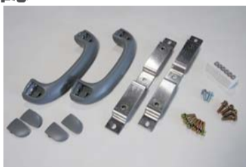
アシストグリップセット