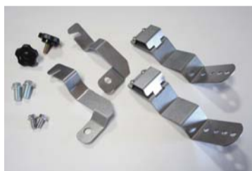
標準ボディ用ブラケット (標準ボディ用のみ)