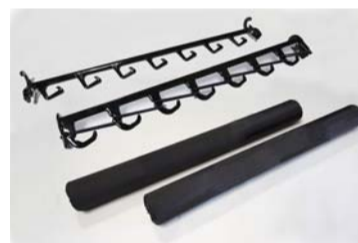
フロント&リアホルダー ウレタンパッド