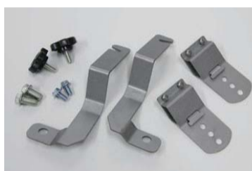
ワイドボディ用ブラケット (ワイドボディ用のみ)